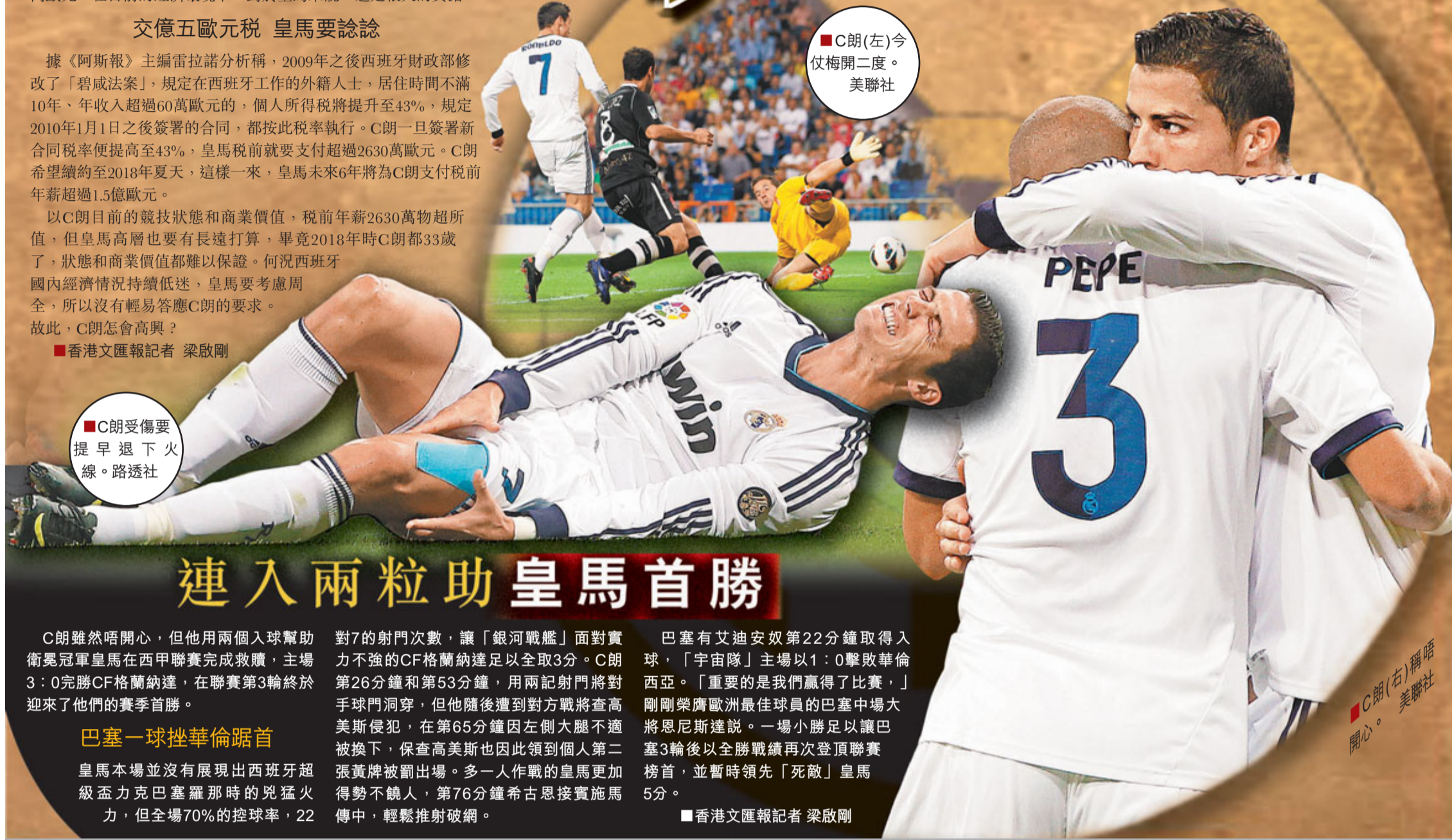
■C朗(左)今仗梅開二度。