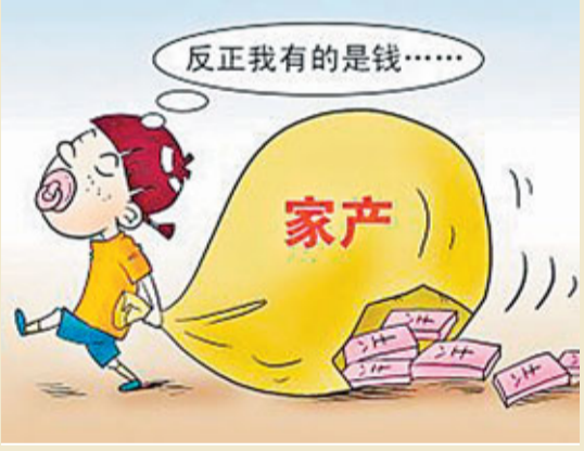
「富不過三代」的警鐘敲響。