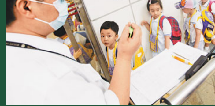
許同學表示，過關耽誤了1小時。