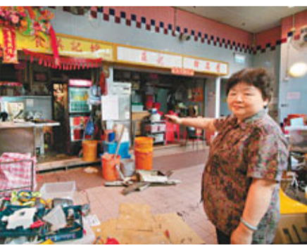
「婦姐」對火警導致同層其他同行都要被暫停營業感到「唔好意思」。

消防員接報到場,動用一隊煙帽隊及一條滅火喉進行灌救,約20分鐘後將火救熄,消防員相信是肇事抽油煙機機件過熱失火,火警無可疑。但由於熟食中