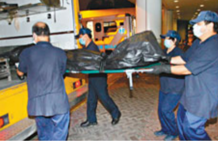
中五重讀生遺體由工仔送殮房。

現場消息稱,當時尾隨其後在路中心察看交通情況的3名同窗,見有車高速而至,曾向莫叫:「唔好過呀,有車!」惜為時已晚,莫已被跑車撞至拋上擋風玻璃,再反彈墮地,頭部重傷昏迷血泊中。