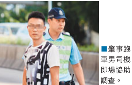
肇事跑車司機即場協助調查。

救護員接報到場將莫急送將軍澳醫院搶救,惜延至下午3時48分證實傷重不治。肇事跑車34歲馬姓司機並無受傷,惟被嚇至神情呆滯,向警員表示「好驚,腦袋一片空白……」須家人帶同律師到場協助,他事後通過呼氣酒精測試。