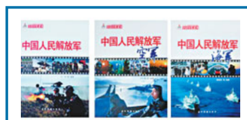
「中國軍隊」系列叢書第1輯。網上圖片

香港文匯報訊 據中國軍網報導, 在昨天的第十九屆北京國際圖書博覽會上, 由國防部新聞事務局與五洲傳媒出版社聯合推出的大型軍事系列叢書「中國軍隊」第1輯正式發行。這是中國首套面向國際社會介紹中國軍隊各軍兵種歷史沿革和發展現狀的圖書。