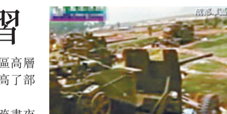
成都軍區某防空旅組織實戰演習。

判斷和決策指示, 始終保持高度的政治意識、憂患意識和責任意識, 不管形勢如何變化, 不管其他任務多麼繁重, 都要堅持軍事鬥爭準備龍頭地位不動搖, 扭住核心軍事能力建設不放鬆, 從難從嚴從實需要出發訓練部隊, 不斷提高部隊信息化條件下作戰能力。要進一步增強戰備觀念、落實戰備制度, 提高部隊戰備水平特別是應急處突能力, 及時妥善處置異常情況和突發事件, 確保國家邊海空防安全穩定。