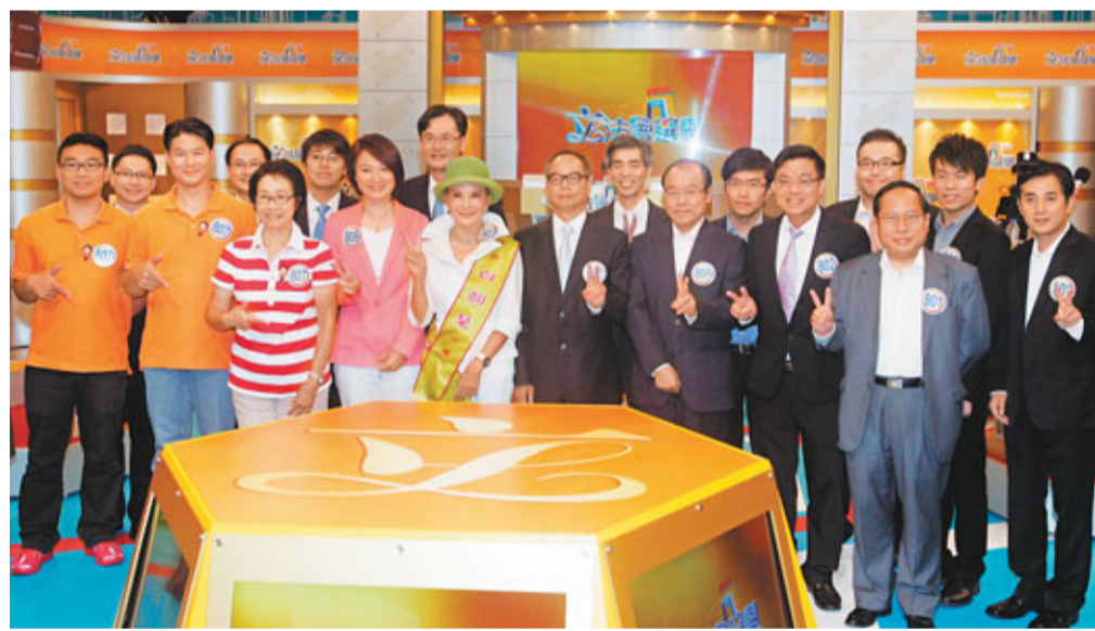
港台舉辦超選電視論壇,7張名單的候選人齊齊合照,先禮後兵。