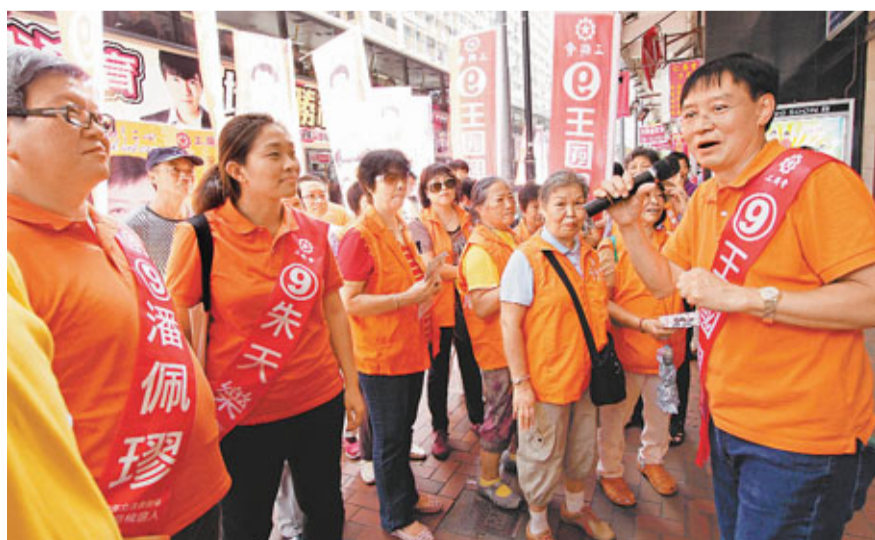
選到一些搞事,搞破壞,有破壞無建設的議員,立法會就真的變成垃圾會了。」

他說:「下星期日就是決定立法會今後發展方向(的日子),如果我們選到正直、敢言、實幹的議員,立法會就會好一點。但是,如果