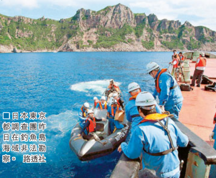
日本東京都調查團昨日在釣魚島海域非法勘察。路透社

廣州軍區在東南沿海某地域，組織師旅級兩個作戰單元，展開實兵自主對抗演習。陸海空三軍都參與這次演習。內容包括轟炸及登島作戰。新華網