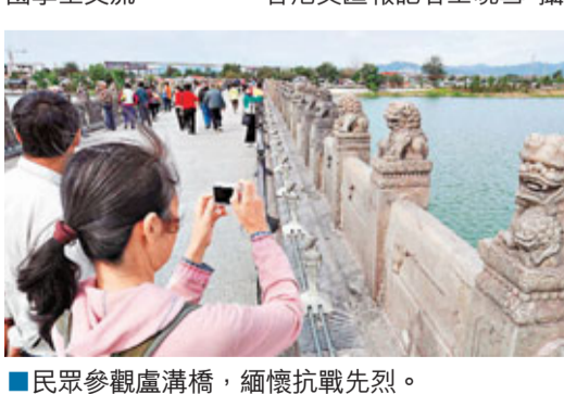
民眾參觀盧溝橋，緬懷抗戰先烈。