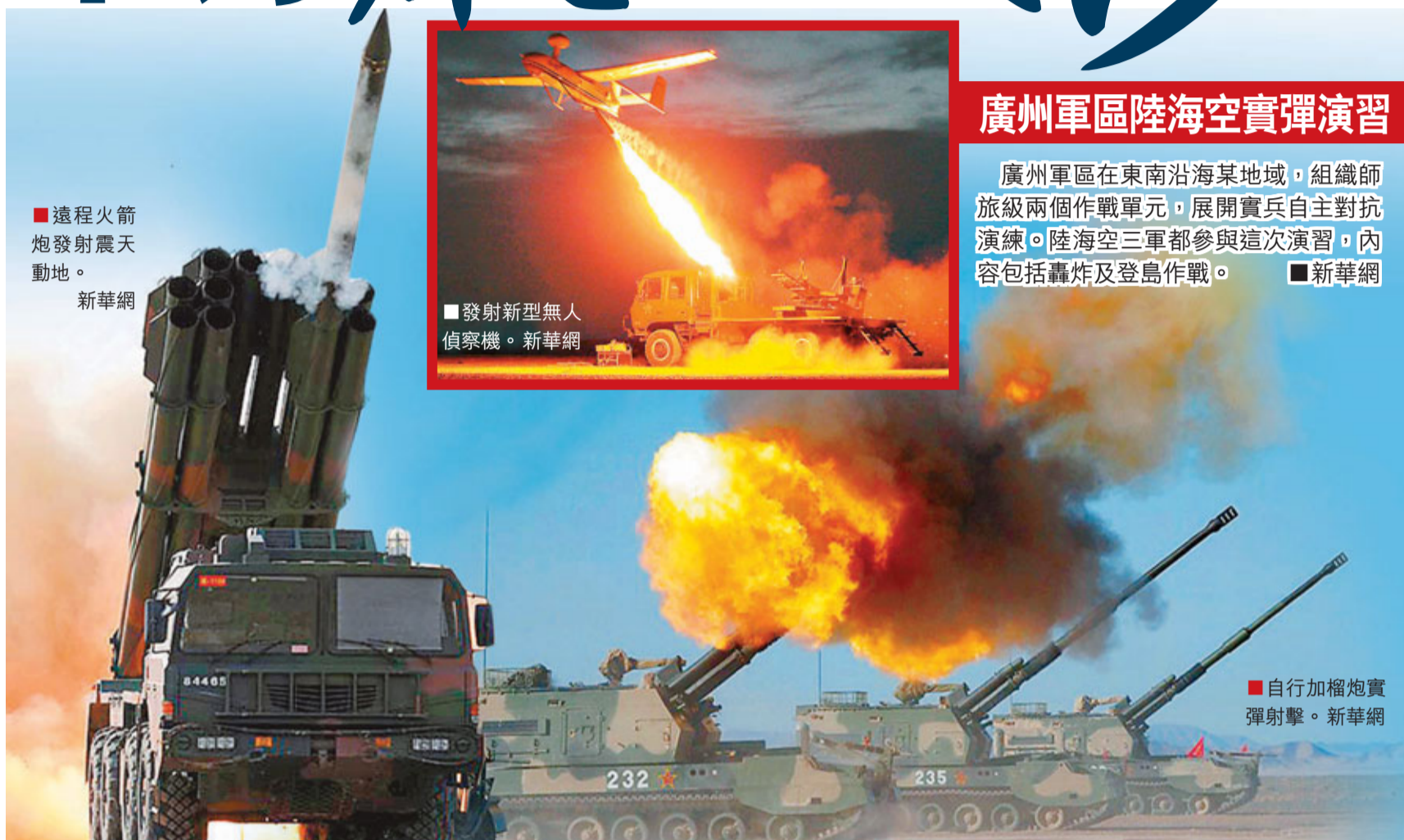
遠程火箭炮發射震天動地。

文章認為，如果日本政府要「兩面派」手法，在釋放善意的同時，繼續放任右翼勢力綁架政府和民意，中日關係將很難得到改善。