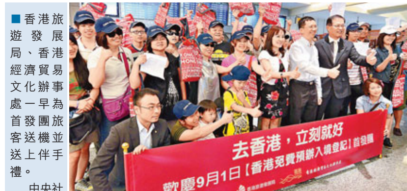
香港旅遊發展局、香港經濟貿易文化辦事處一早為首發團旅客送機並送上伴手禮。