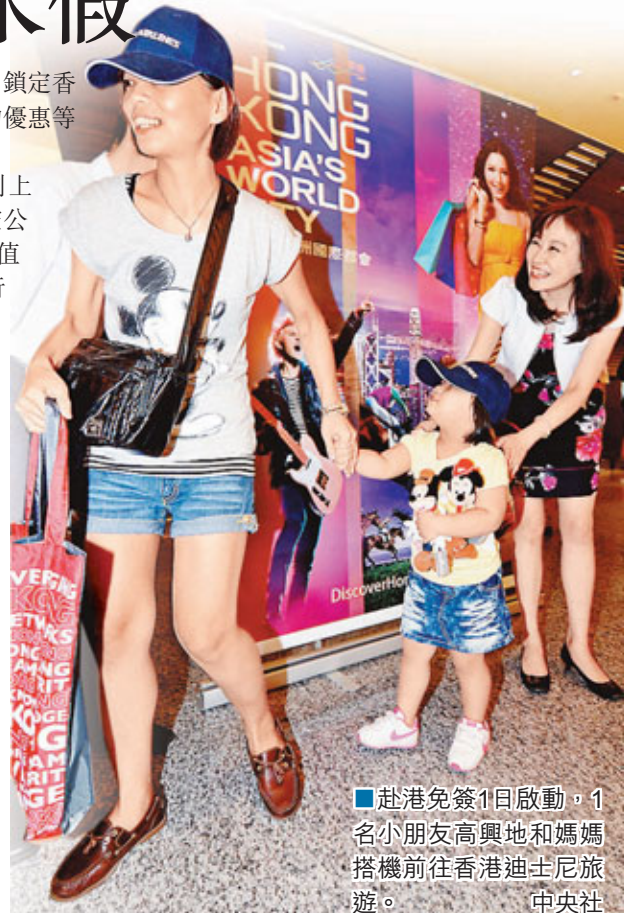
赴港免簽1日啟動,1名小朋友高興地和媽媽搭機前往香港迪士尼旅遊。

梁志仁說,赴港免簽的新措施上路後,台灣民眾可以直接上網申請登記,並且列印申請書,在入港時出示申請書與個人護照即可,手續非常簡便,相關旅遊資訊可參考香港旅遊發展局網站。