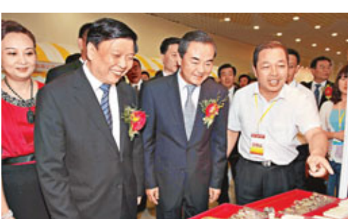
國台辦主任王毅(中)品嚐台灣美食。

及其實施細則的相應修訂和完善。此外大陸還將按照兩岸投保協議的規定,制定經第三地來大陸投資的台商的認定方法,明確司法執行力等。