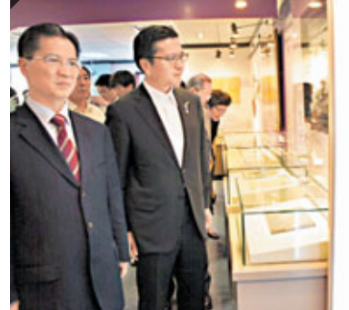
圖為孫中山給長崎記者的題字「天下大同」。

香港文匯報訊(記者沈夢珊上海報導)為紀念中日邦交正常化40周年,《孫中山與梅屋莊吉的友誼紐帶》上海、長崎學術交流展1日