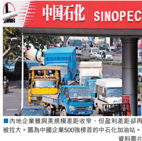
內地企業雖與美規模差距收窄,但盈利差距卻再被拉大。圖為中國企業500強榜首的中石化加油站。

經濟學家為應對經濟減速開出三個藥方。首先,降低準備金率 and 淡化存貸比考核,釋放商業銀行的貸款空間,引入差異化的監管政策,滿足中小企業的正常資金需求。第二,增加城市土地和樓市供應,適量放鬆對基礎設施貸款和中小戶型自住型為主的房地產貸款的行業貸款限制。第三,也應當支持地方政府融資。