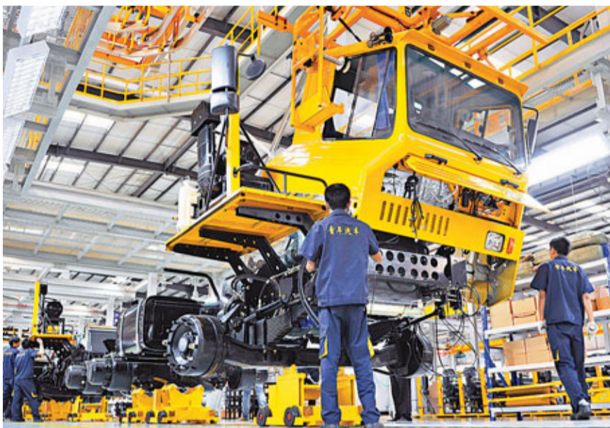
中國官方8月PMI意外降至49.2%,創九個月新低。圖為寧夏石嘴山打造綜合性汽車工業基地,工作人員在裝配卡車。

不過中國物流與採購聯合會表示,經濟運行呈現逐漸築底跡象。國務院發展研究中心宏觀經濟研究員張立群分析稱,從分項指數看,新訂單指數降幅為0.3個百分點,新出口訂單指數與上月持平,積壓訂單指數明顯上升;購進價格指數明顯上升;原材料庫存指數大幅下降,產成品庫存指數略升。這些變化表明企業持有的訂單水平趨穩,