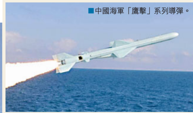
中國海軍「鷹擊」系列導彈。

香港文匯報訊 日本《外交學者》雜誌根據互聯網上出現的圖片揣測,中國海軍可能正在測試一款對陸攻擊巡航導彈,該導彈射程達4000公里。採用慣性制導和衛星制導等多種制導方式。這種導彈的發射裝置與中國052C驅逐艦上的鷹擊-62和鷹擊-83反艦導彈的發射裝置相似。這意味着戰艦只需進行很小的結構調整,就可裝備對陸攻擊巡航導彈。報道還揣測,這款新型導彈不只用於裝備驅逐艦,解放軍已經開始開發其潛射版本,以用於裝備潛艇。