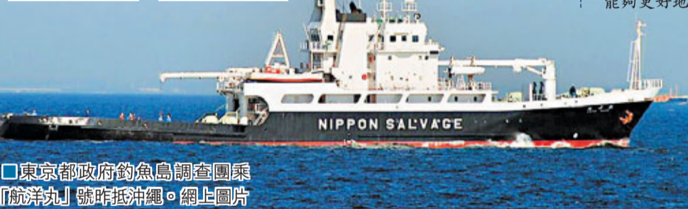
東京都政府釣魚島調查團乘「航洋丸」號昨抵沖繩。