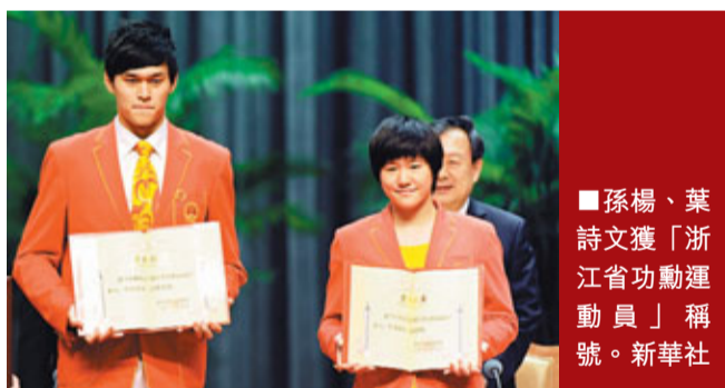
孫楊、葉詩文獲「浙江省功勳運動員」稱號。新華社