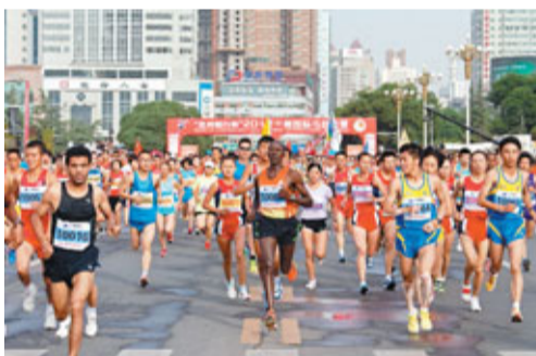
深圳第三度舉辦國際馬拉松賽。

香港文匯報訊(記者 李望賢、實習記者 張瀛戈 報道) 2012年深圳安琪國際馬拉松賽將於12月9日在深圳舉行。這也是深圳繼第26屆大運會之後又一項國際體育賽事。