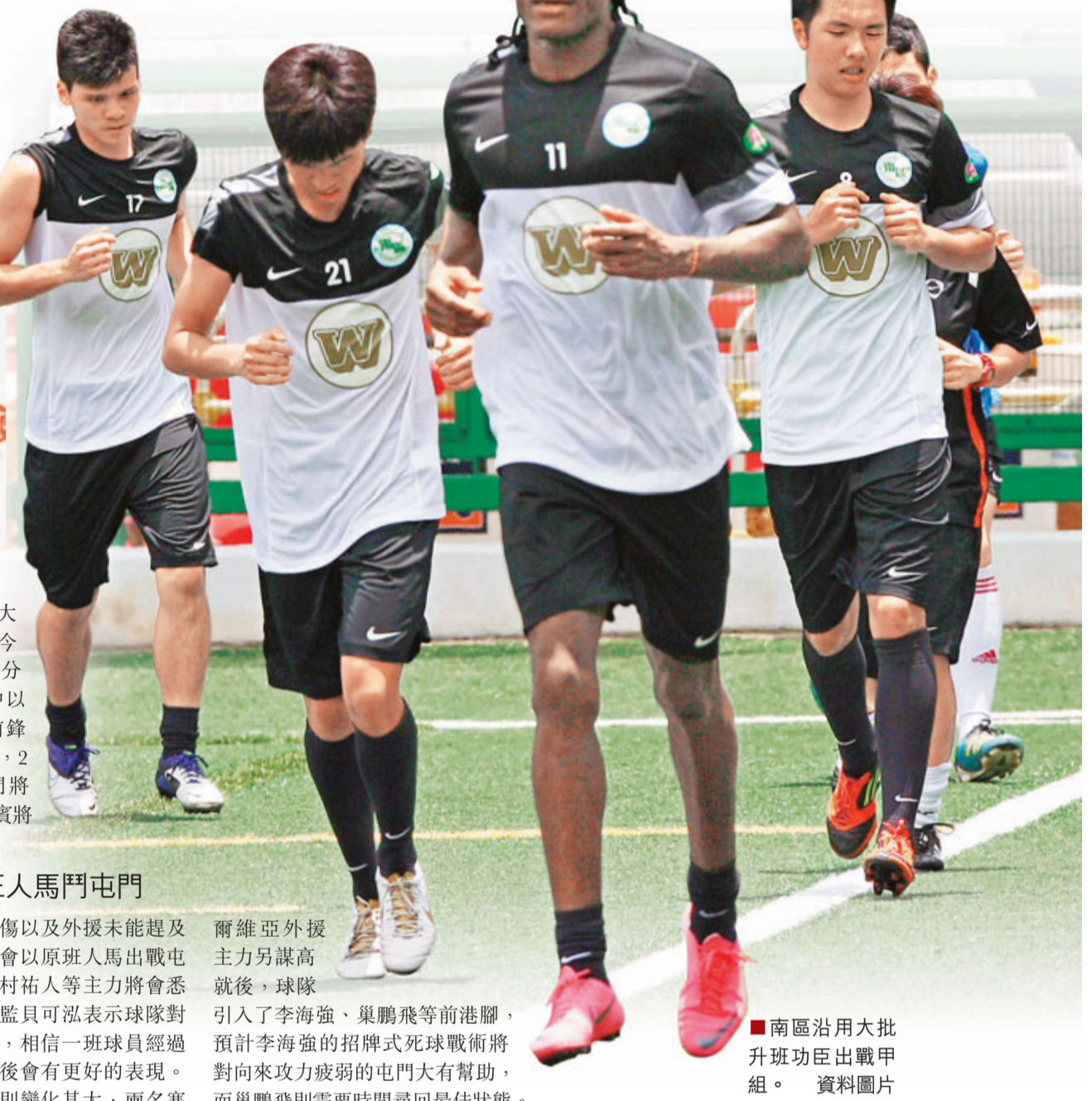
南區沿用大批升班功臣出戰甲組。資料圖片

香港文匯報訊(記者 郭正謙)「加強版」流浪首度登場!今季大肆招兵買馬的標準流浪今日將於深水埗運動場粉墨登場,曾效力南華和晨曦的前金靴基奧雲尼將會首次披起流浪戰衣出戰,面對「升班馬」南區誓要全取3分,為新賽季打響頭炮(now634台今日2:00p.m.直播)。而公民則會假旺角大球場迎戰有多名主力離隊的屯門(now634台今日5:00p.m.直播)。