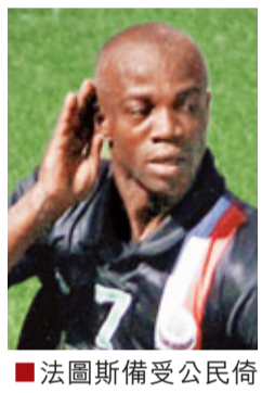
法圖斯備受公民倚重。資料圖片