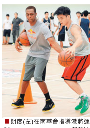
朗度(左)在南華會指導港將運球。

香港文匯報訊(記者 黃舒慧)當杜蘭特以一個華麗明星賽為訪港之旅畫上句號,NBA另一位當紅球星朗度則展開訪港行程的首個活動。塞爾特人未來領軍人物朗度昨晨現身南華會,向一班港籃青年軍傳授球技。憑着去季成績成為一線控球後衛,朗度對來季NBA賽事更有野心,斷言要帶領「綠軍」問鼎來季總冠軍。