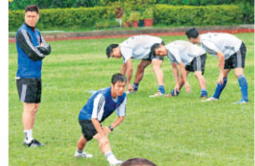
屯門今季陣容面目全非。資料圖片