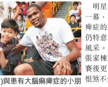
杜蘭特(右)與患有大腦痲痺症的小朋友觀賽。

早前被林書豪盛讚為「最佳控球後衛」,「Cool爆」的朗度不但不領情,還揚言林書豪將成「眾矢之的」:「他來季加盟火箭,按照現時火箭的陣容來看,他必定成為其他隊球員的重點防範對象。」這位「牙擦」球星還放言,新賽季定要帶領塞爾特人擊敗由林書豪領軍的火箭,向NBA總冠軍邁進,成為「綠軍」的最佳控球後衛。朗度將於今日下午3時半現身西環招商局碼頭舉行的港澳區籃球決賽,與一班球員粉絲作近距離接觸。