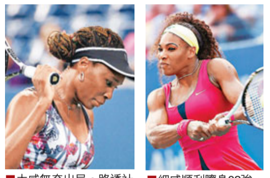
大威無奈出局。

從未在大滿貫賽晉級32強的斯洛伐克新銳克里贊以總盤數3:1擊敗宋加,讓對手5年來首度無緣大滿貫32強。女單方面,32歲的大威與6號種子、德國球手卻芭慶戰近3小時,最終以總盤數1:2告負。