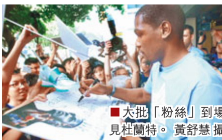
■大批「粉絲」到場見杜蘭特。

香港文匯報訊(記者黃舒慧)NBA「得分王」杜蘭特昨日展開訪港之旅的第1日行程,便馬不停蹄連跑兩場。先在「全港青少年超級籃球聯賽訓練營」活動向一班年青籃球球員傳授高招,其後又趕往灣仔的Nike專門店出席記者會,與一班球迷粉絲作近距離交流。