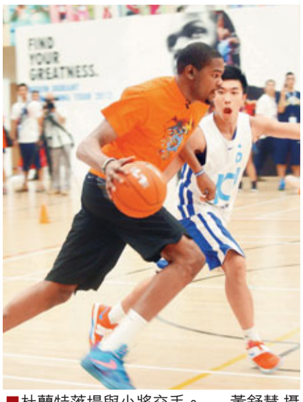
■杜蘭特落場與小將交手。