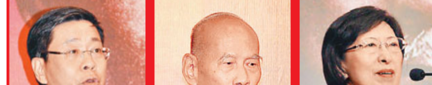
上海市委常委沙海林部長致辭。