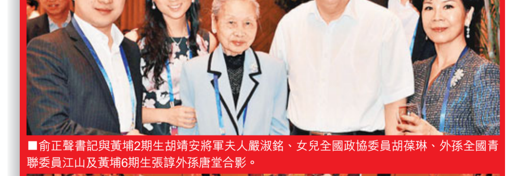
俞正聲書記與黃埔2期生胡靖安將軍夫人嚴淑銘、女兒全國政協委員胡葆琳、外孫全國青聯委員江山及黃埔6期生張謙外孫盧堂合影。