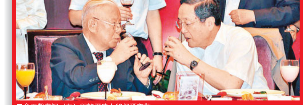
俞正聲書記（右）與許歷農上將把酒言歡。