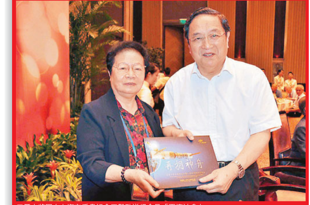
聶力將軍向上海市委書記俞正聲致送紀念品「再擁神舟」。