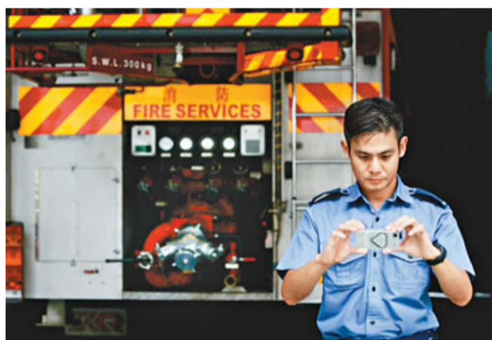
■消防處職工總會對新方案有保留,或發起遊行及靜坐表達訴求。

不過消防處職工總會主席李德其對新方案有保留,因以往爭取的是每周工作48小時,新方案只