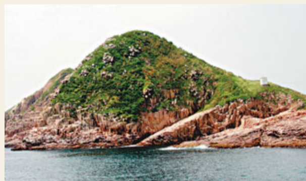
■該座火山已成死火山,沒有爆發危機。