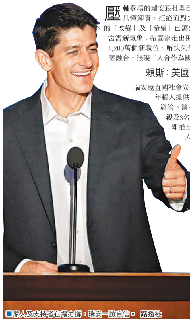
家人及支持者在場力撐，瑞安一臉自信。