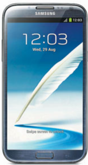
Galaxy Note II 正面

當外界揣測三星於專利戰敗訴後如何應對時，這家Android智能手機大廠前日突推出Galaxy Note II，且毫無先兆地發表全球首款微軟Windows Phone 8手機「Ativ S」，搶先另一家手機製造商諾基亞足足一周。分析指，三星受專利掣肘正調整戰略，未來或加強與微軟合作。