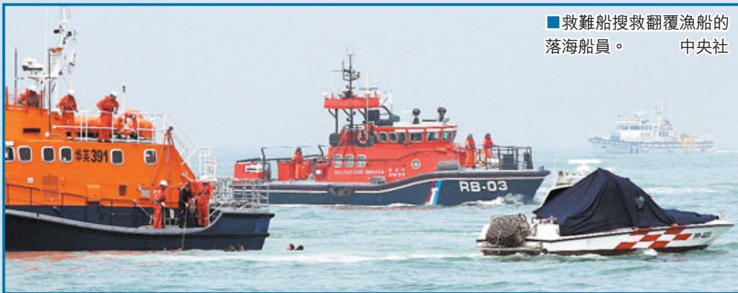
■救難船搜救翻覆漁船的落海船員。中央社

兩岸直航客機「迫降」海面，「撞傷」兩岸直航客輪，並導致漁船傾覆，50餘人「墜海」。兩岸相關機構海空力量緊急出動，僅僅用半小時就全部「救起」遇險人員。這是昨日在廈門海域舉行的2012海峽兩岸海上搜救聯合演練場景。