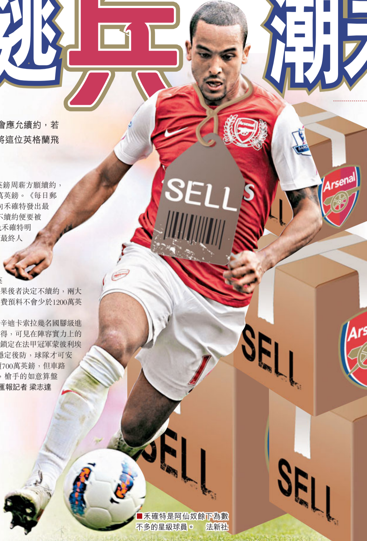
■禾確特是阿仙奴餘下為數不多的星級球員。