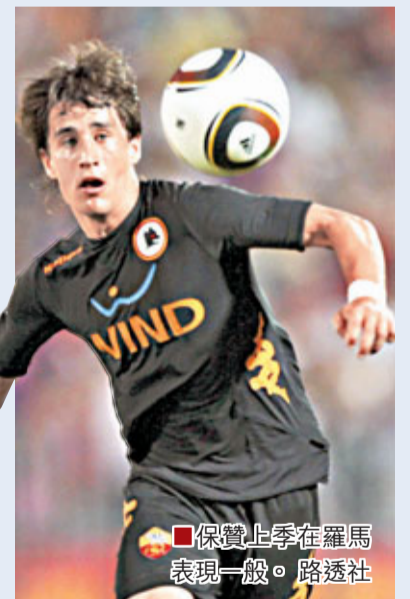
■保贊上季在羅馬表現一般。

AC簽入保贊及宣布放棄回收卡卡後，副主席加利亞尼宣布今夏將不會再增兵。西甲皇家馬德里盛傳正全力羅致里爾的27歲法國國腳右翼衛迪保治，巴西中場卡卡則已不在教練摩連奴的未來計劃之中，卡卡的