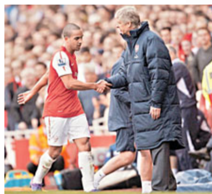
■如果禾確特要離隊，雲加(右)絕不會平賣。