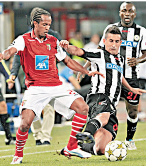
■布拉加的沙連奴(左)截擊烏甸中場比斯。

2012/13球季的歐洲聯賽冠軍盃今晚會進行分組抽籤(有線61台及201高清台今晚11:45p.m.直播)，8組每組會有來自4個不同種子檔次及不同足總的球隊。第一檔次為英超車路士、曼聯、阿仙奴、西甲皇家馬德里、巴塞羅那，意甲AC米蘭，德甲拜仁慕尼黑與葡超波圖。第二檔為英超曼城、西甲華倫西亞、葡超賓菲加與布拉加、烏克蘭基輔戴拿模與薩克達、德甲史浩克04、俄超辛尼特，而第3、4檔次的勁旅有意甲祖雲達斯、德甲多蒙特與法甲巴黎聖日耳門，故不排除會出現巴塞、曼城、祖雲達斯與巴黎聖日耳門或多蒙特被抽在一起的「死亡之組」。