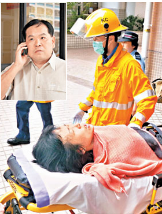
圖以死控婦人送院時高呼「醫院醫死我個仔，我要見院長」。小圖為企跳婦丈夫。

未幾，警員和消防員趕到，發現鄭婦反鎖單位大門，遂在樓下張開救生氣墊以防萬一，又派出多名