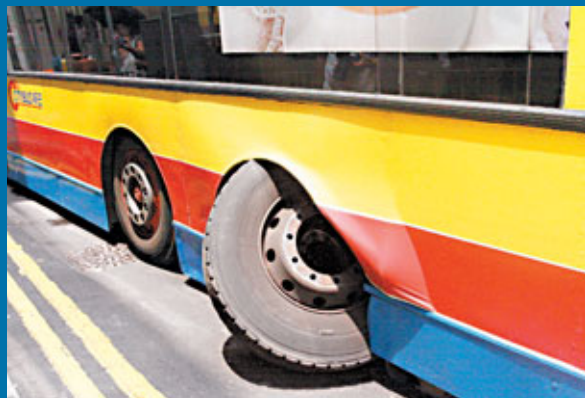
甩輪城巴的另一輪胎仍卡在沙板內。