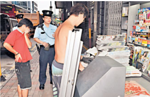
警員在觀塘遭抹糞便報檔調查。