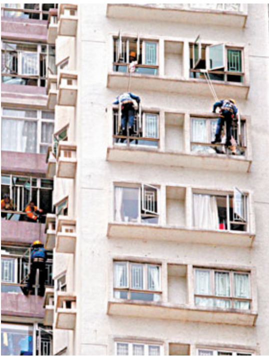
消防「飛將軍」游繩戒備，準備隨時拯救屋內關自殺婦人。

據悉，鄭婦送院時被「五花大綁」，但仍十分激動，不斷大叫着「我要見屯門醫院院長」。而從深圳趕回來的丈夫對情況亦十分無奈，稱：「(醫院)拆散咗我一家，依家差人連我間屋(門)都拆埋」。