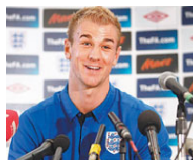
英格蘭門神赫特。 城的Umbro波衫下季也會換成Nike。 ■綜合外電

Umbro與英足的合約到2018年屆滿，但英足總上週宣布雙方將終止合作。據悉，Nike在2007年以2.85億英鎊收購Umbro後，首先將英足的作客球衣換成Nike，並在兩年後將主場球衣也換成Nike的標誌。同時，曼