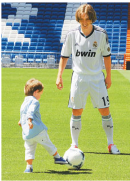
莫迪歷亮相班拿貝，跟兒子踢球。