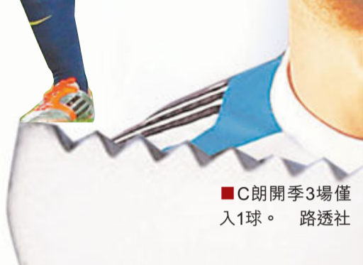
C朗開季3場僅入1球。