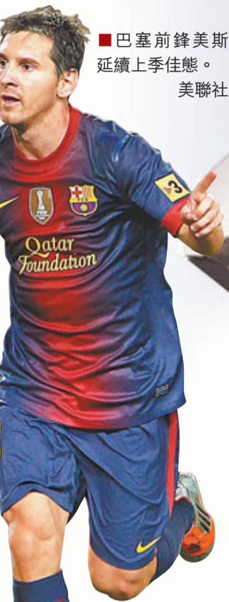
巴塞前鋒美斯延續上季佳態。