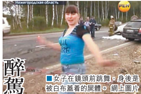
■女子在鏡頭前跳舞，身後是被白布蓋着的屍體。