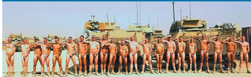
■英國皇家騎兵團21名士兵裸露坦克前敬禮。