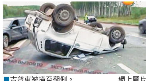
■吉普車被撞至翻側。