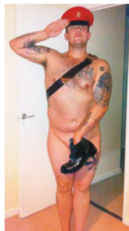
■男網民頭戴軍帽，手拿皮靴遮重要部位。