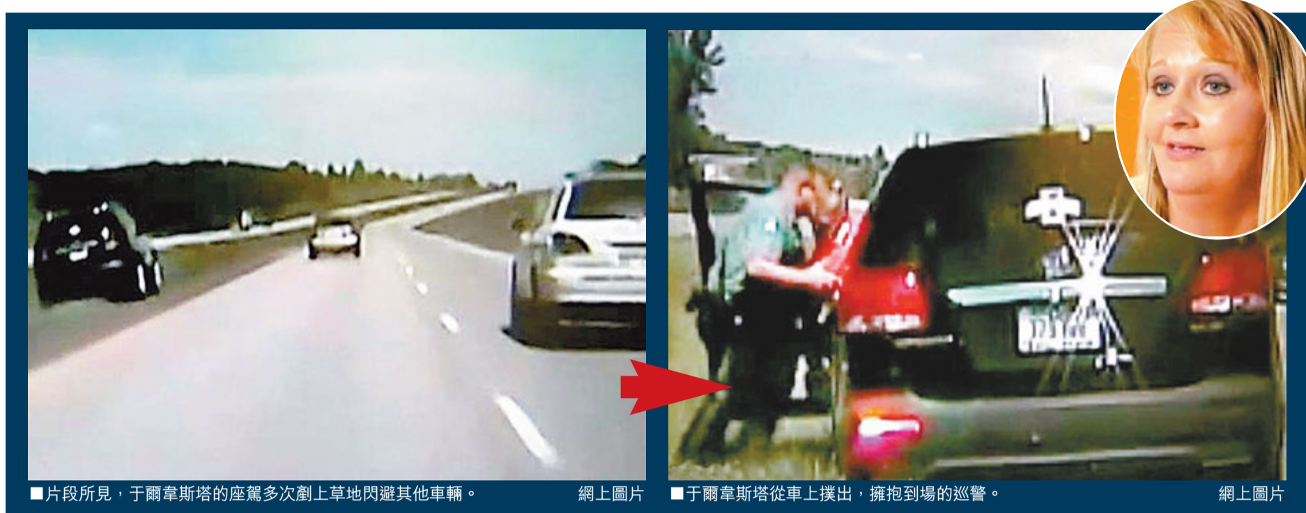
■片段所見，于爾韋斯塔的座駕多次劇上草地閃避其他車輛。