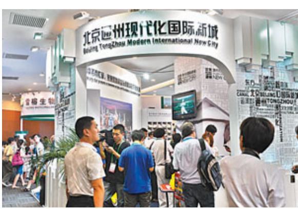
國際食用菌大會上的通州展區

據了解，通州區食用菌產業獨特，在內地率先開發應用平原地區林地食用菌生產模式，截至目前，全區擁有林地食用菌1萬畝。通州並引進馴化出了內地特有品種—白靈菇，白靈菇是通州於1997年自新疆引進阿魏側耳經馴化後形成的食用菌優良品種。白靈菇作為通州自主命名，並擁有獨立知識產權的食用菌品種聞名內地各省市，在海外也享有極高的聲譽。