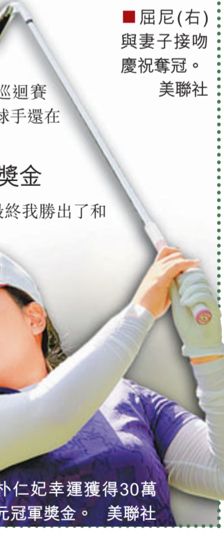
■朴仁妃幸運獲得30萬美元冠軍獎金。