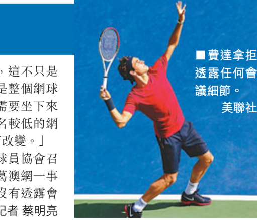
■費達拿拒透露任何會議細節。

夠金錢支持整年的開支，這不只是大滿貫賽事的問題，而是整個網球壇的問題。我認為我們需要坐下來商討有關事件，因為排名較低的網球手獎金，已有25年沒有改變。」在美網開賽前，ATP球員協會召開大會，據報會議與杯葛澳網一事有關，不過主席費達拿沒有透露會議內容。■香港文匯報記者 蔡明亮