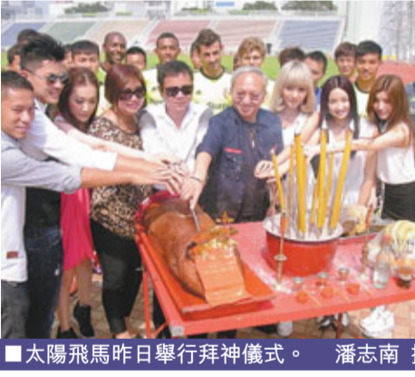
■太陽飛馬昨日舉行拜神儀式。

香港文匯報訊(記者 潘志南)連續第2個球季負責直播港甲聯賽的now電視台，昨午宣布在新球季不會直播或轉播不願意支付每月2萬元轉播費的晨曦所有主場或作客賽事，包括賽季內的其餘三大盃賽。 根據總足與電視台的協議，今季10支甲組球隊每月須付出2萬元轉播費，但晨曦仍然和上屆一樣，認為不合理而拒絕支付轉播費。合約訂明電視台從轉播賽事中所得到的廣告收入，部分會平均分子球會，但上屆9支甲組球隊只是首個月分得萬元收入，轉播一直蝕本中。 較早前有消息指該台限制電子媒體只許賽前和賽後入場採訪，比賽片段須由獲轉播權的電視台提供，但該台公布維持過往電子傳媒採訪守則，任由各媒體在現場拍攝比賽過程、賽前和賽後訪問。