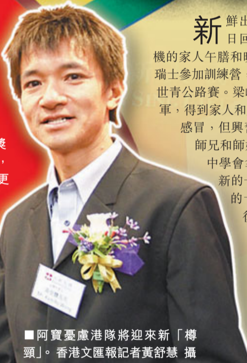
■阿寶憂慮港隊將迎來新「樽頸」。