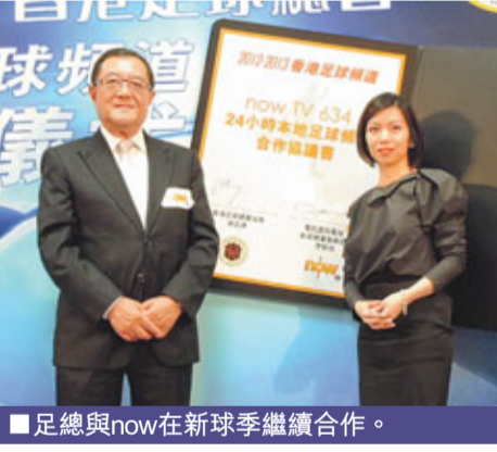
■總足與now在新球季繼續合作。