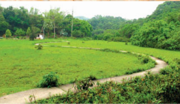
古道沿途植被豐富，多草坪，非常適合郊遊。

走過「清快塘」村後，一直沿石路往下走，這兒視野廣闊開揚，遙望可看到大欖隧道公路、青山公路邊的大廈。再往下走，便可到達元荃古道的另一頭深井。