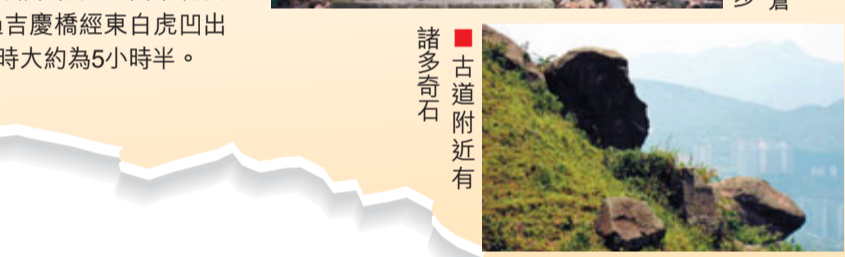
古道附近有諸多奇石