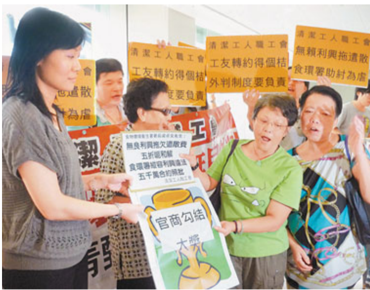
外判清潔工抗議食環署落實扣分制，將拖欠工人遣散費的涉事公司列入黑名單。

香港文匯報訊(記者 李彩荷) 約批給涉事的食環署外判商。勞資審裁處今年7月裁定160多名工人在追討遣散費的審訊中勝訴，但至昨日止僅5人取回遣散費。工會要求當局落實扣分制，並把該外判