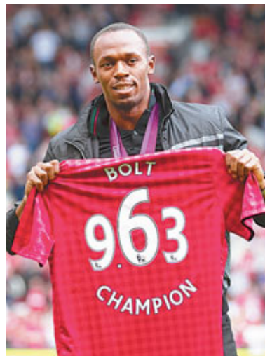
保持獲贈963號紅魔戰袍。