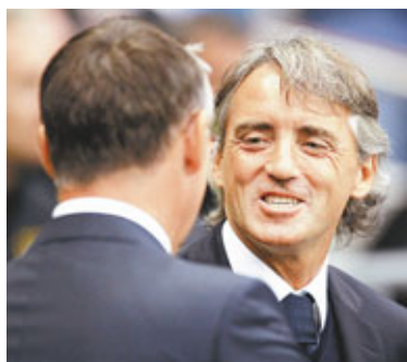
文仙尼不滿高層未肯再增兵。

儘管文仙尼上月剛與曼城續簽了5年新合約,但《每日郵報》稱這位意大利名帥隨時可能會「劈炮」走人。一名知情人透露說:「在轉會市場關閉前,他還有3個羅致目標:迪羅斯、馬爾干和祖維迪,讓我們看看緊接會發生甚麼事。文仙尼感到球會根本沒人負責轉會工作,新球季只有19名球員可用,這讓他很憤怒。他是個有野心的人,剛剛贏得英超冠軍,現在他想稱霸歐聯,如果沒足夠支持,他便沒可