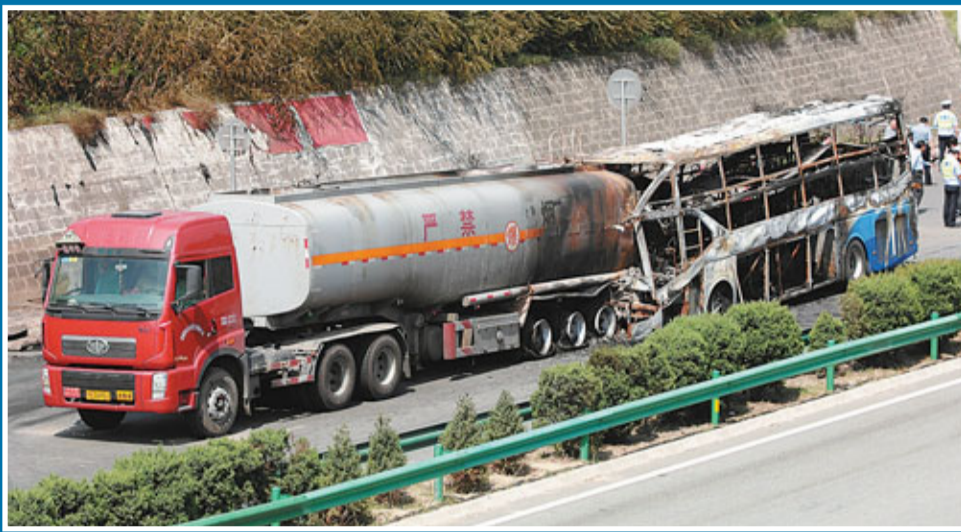
■包茂高速陝西延安段，26日發生一輛雙層臥鋪客車和一輛裝有甲醇的罐車追尾事故，並致兩車起火共造成36人死亡。

據了解，目前事故原因正在調查中，相關部門正在核實遇難人員的身份並通知家屬。不過，部分死者被燒至面目難辨，其身份仍有待調查。事故發生後，陝西省委書記趙樂際、省長趙正永分別作出批示，同時迅速成立8、26交通事故調查處理領導小組，積極調查事故原因，指導當地妥善善後，查清死者身份，並請內蒙共同處理。國務院也已成立事故調查組，指導地方做好搶救傷員和善後處理工作。陝西省有關部門將於今日召開緊急會議，對道路交通、煤礦、非煤礦山、危險化學品、建築施工等重點領域安全生產工作進行再安排、再部署，集中開展為期60