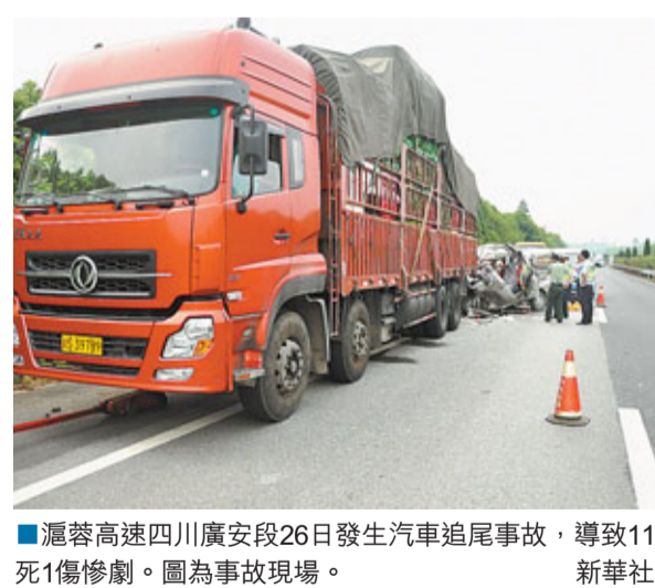
■瀘蓉高速四川廣安段26日發生汽車追尾事故，導致11死1傷慘劇。圖為事故現場。

經現場處理事故的交警初步調查，追尾麵包車連同駕駛員共有12人，其中有3名小孩。事故具體原因因高速交警還在調查處理中。