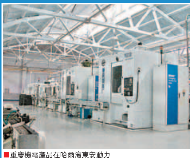
■重慶機電產品在哈爾濱東安動力

今年上半年,重慶機電獲得國家專利授權100餘項,較之去年增加5倍之多。公司旗下重慶機床集團、重慶卡福公司成功申報重慶市名牌產品3個,重慶水泵公司獲得重慶市著名商標。重慶通用集團W6-39系列回熱風機、2.0MW風電葉片,重慶機床集團YS3126CNC系列數控高速乾切滾齒機,重慶水輪公司高水頭衝擊式水輪發電機組,基齒傳動QJ705變速器等20餘項產品和技術成為重慶市重點新產品、高新技術產品、技術創新項目。重慶機床集團成功申報國家科技重大專項2013課題1個,完成重慶市科技攻關計劃項目驗收3項。