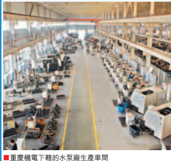
■重慶機電下轄的水泵廠生產車間