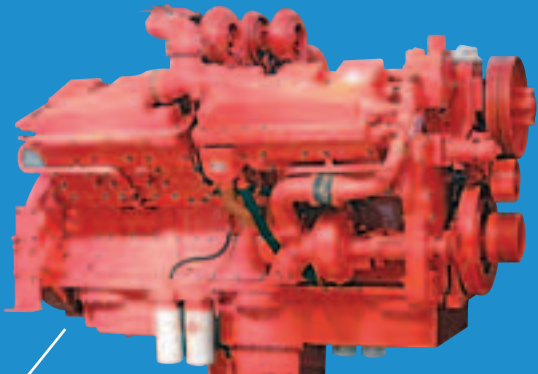
■重慶機電生產的康明斯發動機

重慶機電股份有限公司(以下簡稱重慶機電)是經重慶市人民政府和重慶市國有資產監督管理委員會批准,由重慶機電控股(集團)公司聯合重慶渝富資產經營管理有限公司、重慶建工集團有限責任公司和中國華融資產管理公司等四家國有獨資公司以發起方式共同設立,於2007年7月27日註冊成立的股份有限公司。2008年6月13日公司在香港H股上市,成功登陸國際資本市場,股票代碼2722.HK。