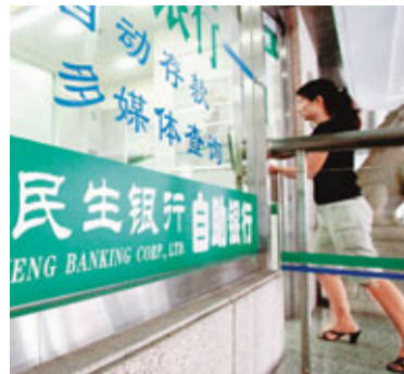
在內銀股低潮期下，民生銀行繼續領風騷。

香港文匯報訊(記者 馬子豪)在內銀股低潮期下，民生銀行(1988)繼續領風騷，中期純利按年增36.89%至190.53億元(人民幣，下同)，單計第二季，純利亦按季增長7.7%；中期每股盈利0.69元，並派中期息0.15元。 民行中期淨利息收入378.71億元，按年增長28.2%；期內淨息差為3.14%，較首季下跌0.15個百分點。截至6月底，該行貸款及墊款總額為1.25萬億元，按年增13.9%；其中該行主打的小微企業貸款餘額，則較去年底增加7.83%均2,506.95億元。