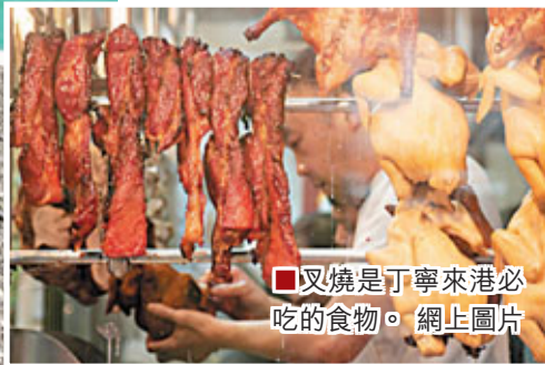
叉燒是丁寧來港必吃的食物。