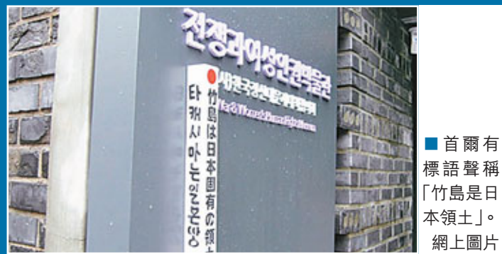
首爾有標語聲稱「竹島是日本領土」。網上圖片

韓日打外交口水戰之際，首爾前日驚現「竹島是日本領土」木樁，以及用日、韓、英文書寫的反韓標語。警方在閉路電視畫面，發現疑犯為20至50多歲的日本男子。 ■韓聯社/共同社/中央社