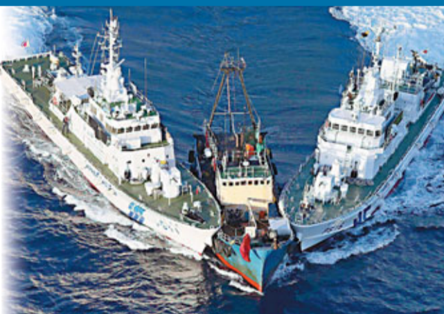
日本計劃建造新巡視船阻礙中國保釣人士登上釣魚島。圖為「啟豐二號」被日方船隻攔截。資料圖片

此外，日本新聞網報道，日本政府考慮制定《領域警備法》，以對付類似中國保釣人士登陸釣