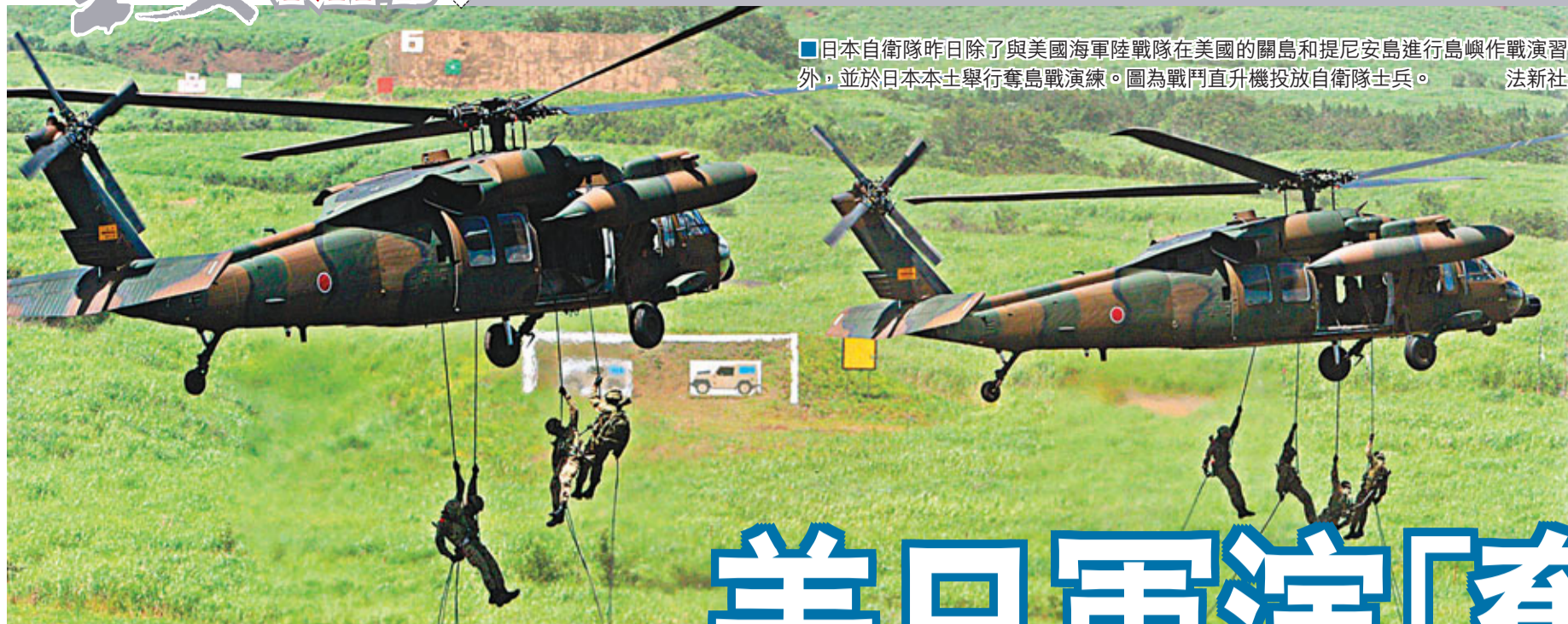
日本自衛隊昨日除了與美國海軍陸戰隊在美國的關島和提尼安島進行島嶼作戰演習外，並於日本本土舉行奪島戰演練。圖為戰鬥直升機投放自衛隊士兵。