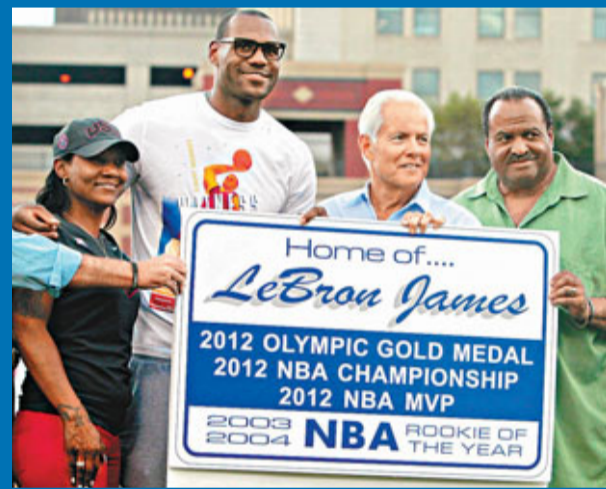
勒邦占士(左二)衣錦還鄉。

今年連奪雙料MVP、NBA總冠軍和奧運會金牌的「大帝」勒邦占士，周日衣錦還鄉，返回俄亥俄州阿克隆，出席一場棒球小聯盟賽事，獲得現場逾3800名球迷歡呼致敬。1年內盡享所有榮譽，成為米高佐敦後第一人，不過占士並未滿足現狀，周日親證希望第四度參加奧運會，出征2016年里約熱內盧奧運。