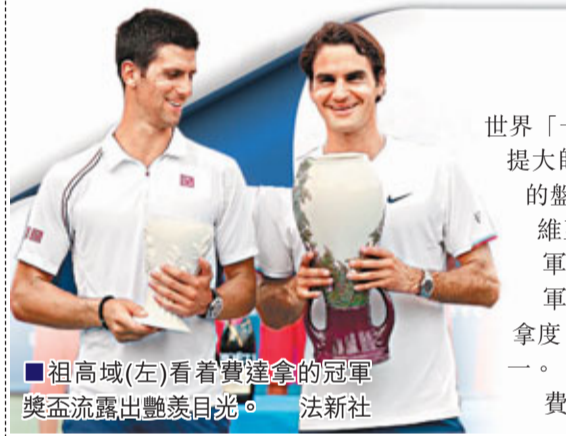
祖高域(左)看着費達拿的冠軍獎盃流露出羨慕目光。

世界「一哥」費達拿在周日的辛辛那提大師賽男單決賽中，以6:0和7:6的盤數擊敗世界排名第2位的塞爾維亞球手祖高域，第5度高舉冠軍獎盃，並將個人的大師賽冠軍數目增加至21個，追平宿敵拿度，二人並列大師賽冠軍總數第一。