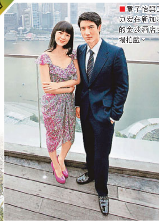
章子怡與王力宏在新加坡的金沙酒店現場拍戲。