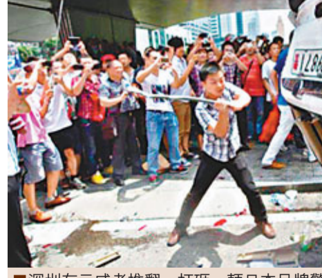
深圳有示威者推翻、打砸一輛日本品牌警車。資料圖片

均有警察維持秩序，遊行抗議活動整體平穩。不過，從不少旁觀者和親歷者的描述來看，也有個別地方出現了極不冷靜和不理性的行為，有人受到一些別有用心者的煽動起哄，打砸同胞開的日系車，讓人感覺非常刺眼。