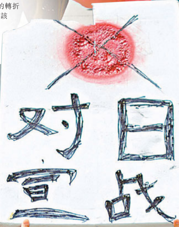
多地日本使館傳出有民眾聚集抗議，民眾自備標語參與反對日本侵佔釣魚台示威遊行。