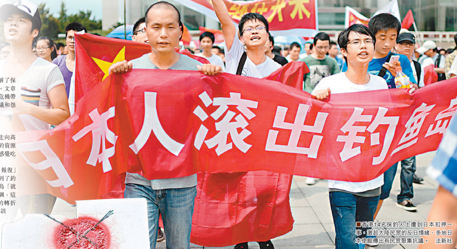
香港14名保釣人士遭到日本扣押一事，激起大陸民眾的反日情緒，多地日本使館傳出有民眾聚集抗議。

社論警告，不願意發生軍事衝突，不意味着中國懼怕戰爭解決。只要日本出動自衛隊，中國動用海軍就是完全可以預期的。日本一定會為今年以來「購買釣魚島」等挑釁行為付出代價，其結果必會比預想的糟很多。