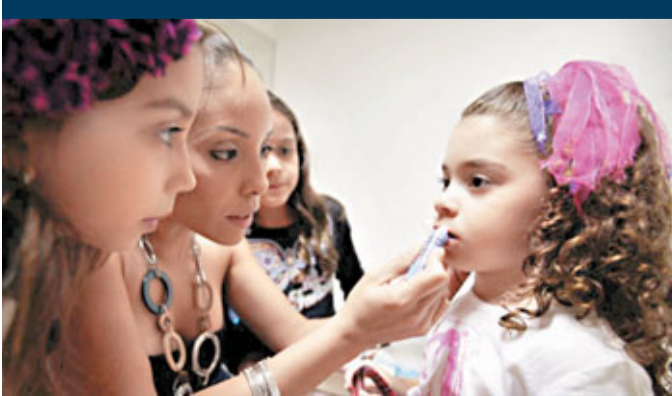
「選美工廠」中會教女童化妝。網上圖片