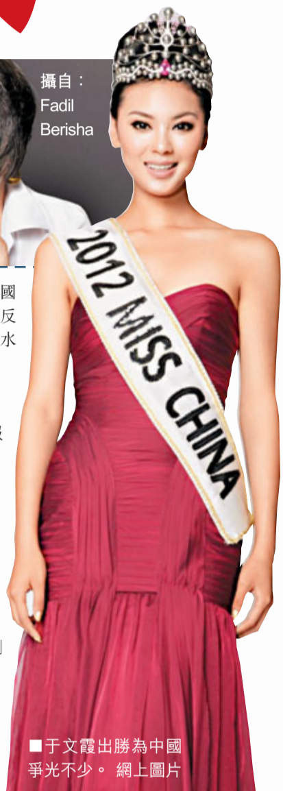
于文霞出勝為中國爭光不少。