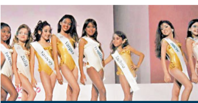
不少委內瑞拉女童都愛參加選美。

委內瑞拉「選美教父」索薩曾揚言，選美秘訣是準備充分。他甚至稱只要使用他自創的公式，任何國家都可隨心所欲製造選美皇后。