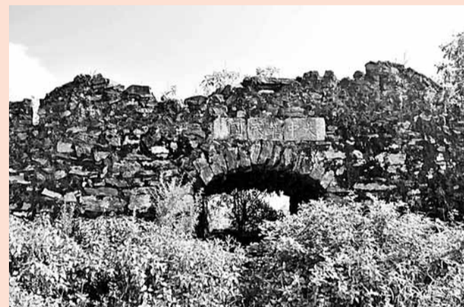
■雲南邊境僅存的老國門，位於文山馬關縣都龍邊境。

在圈層佈局上，文山構建文(山)硯(山)平(遠街)經濟圈，按照培育產業基地和新興工業核心區要求，培育聚集城市集群、企業集群、產業集群和物流中心，增強產業區域擴散和輻射能力，參與西南和東南亞產業競爭，重點發展三七製藥、重化工、農副產品加工及物流產業；天保口岸經濟圈，構建商貿、物流配送、加工和旅遊4大產業；富寧港經濟圈，借助富寧港建成並輔之以必要的航運改造，珠江水運航運將全面貫通雲南、廣西、廣東等省區的優勢，發展物流、商貿、旅遊等主導產業和特色農業、林業、畜牧業、礦電業等附屬產業。