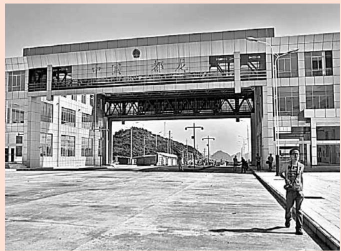
■都龍口岸的開通，已上報國家層面待批。