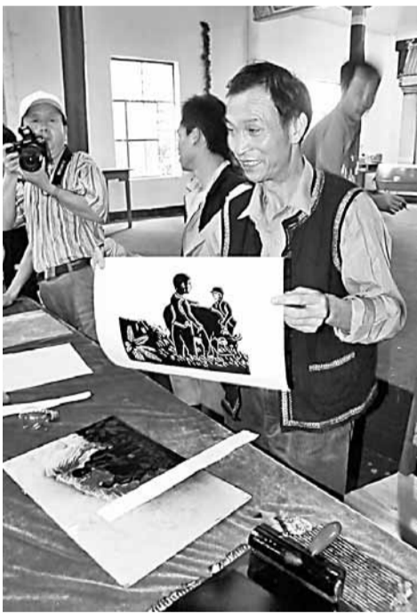
■馬關壯族農家版畫，為文山旅遊業增色。

文山依托自然山水優美、民族風情濃郁、邊關文化獨特、自然環境舒適的優勢，提出「構建面向泛珠三角和東盟的旅遊集散中心和獨具