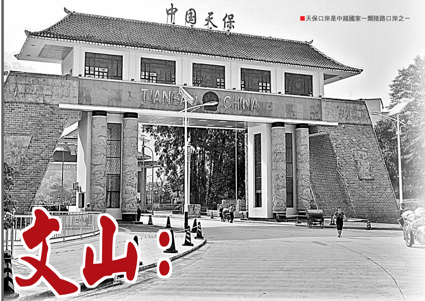
■天保口岸是中越國家一類陸路口岸之一