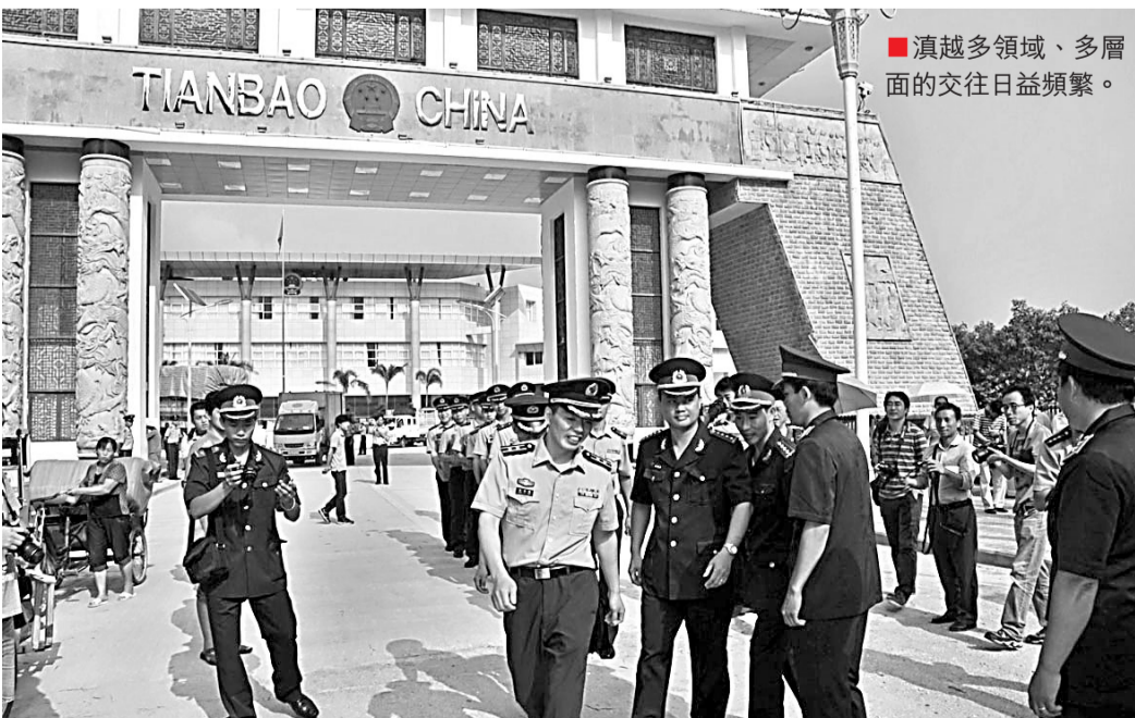
■滇越多領域、多層面的交往日益頻繁。

文山圍繞中心城市、交通節點、港口、邊境口岸，規劃佈局5個重點物流中心，培育實力強大的物流企業，打造面向東南亞、泛珠三角的區域性物流基礎平台，其目標是滇東南重要的物流樞紐和集散基地。