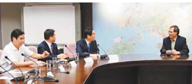
馬衛光率寧波代表團與漁農自然護理署長黃志光等交流。

香港文匯報訊(特約記者 康莊嚴, 記者 茅建興、潘恒) 寧波市副市長馬衛光昨日率團拜訪香港漁農自然護理署，署長黃志光、助理署長廖季堅等會見了寧波代表團一行。黃志光介紹說，甬港兩地淵源流長，早期許多寧波人就到香港發展，香港一些漁農發展的基金也來源於寧波籍人士的捐獻，甬港兩地均是港口城市，農業的比重與發展都有很多相似之處。署方願意推動兩地漁農業方面的交流與合作，將會找機會到寧波去看一看，相互借鑒和學習。