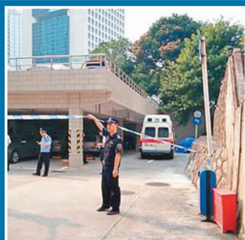
一名女子8月8日在深圳市公安局辦證大廳停車場被殺,警員到場調查。

集中力量、整合手段,開展破案攻堅,明確打擊重點和職責,加大對團伙作案和多發性類案的打擊處理力度,重點加大對出租屋、娛樂休閒場所等的管理力度,以信息化實戰應用為抓手,全面提升打防管控整體水平。同時,警方提示,市民開車外出,在離開車輛時要鎖好門窗,切勿將貴重物品放置在車內,並將車停放在有人看管的場所,確保安全。