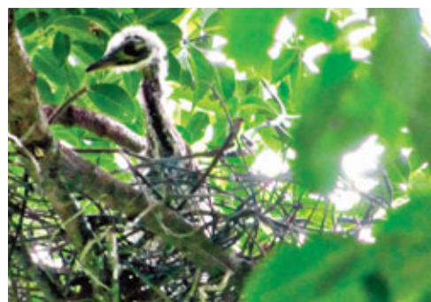
圖為在南雄出現的海南鵑。

海南鵑又名海南虎斑鵑。此鳥係英國人於第一次鴉片戰爭時期在中國海南島首次發現,因長期以來僅在英國大英博物館保存有一副標本,故又被稱之為「世界上最神秘的鳥」。