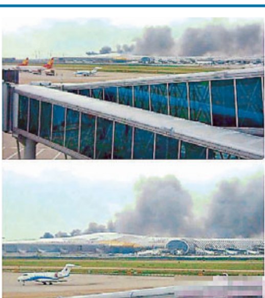
深圳機場T3航站樓工地發生火災,濃煙滾滾。