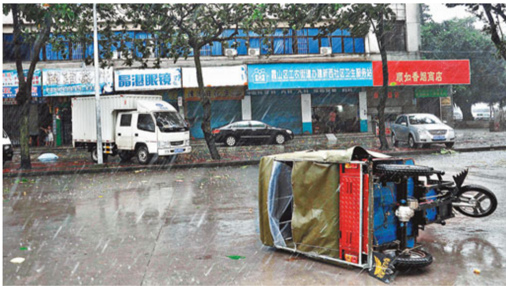
在湛江市區一輛三輪車被大風吹倒。