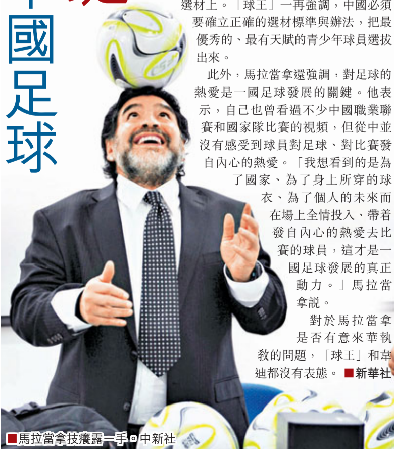
■馬拉當拿技癢露一手。

國家體育總局足球運動管理中心主任韋迪16日會見了來華的阿根廷「球王」馬拉當拿一行。雙方就中國足球如何發展、青少年訓練等話題進行了交談。馬拉當拿在談話中多次強調，中國足球青訓的核心是必須正確選材並培養孩子們對足球的熱愛。