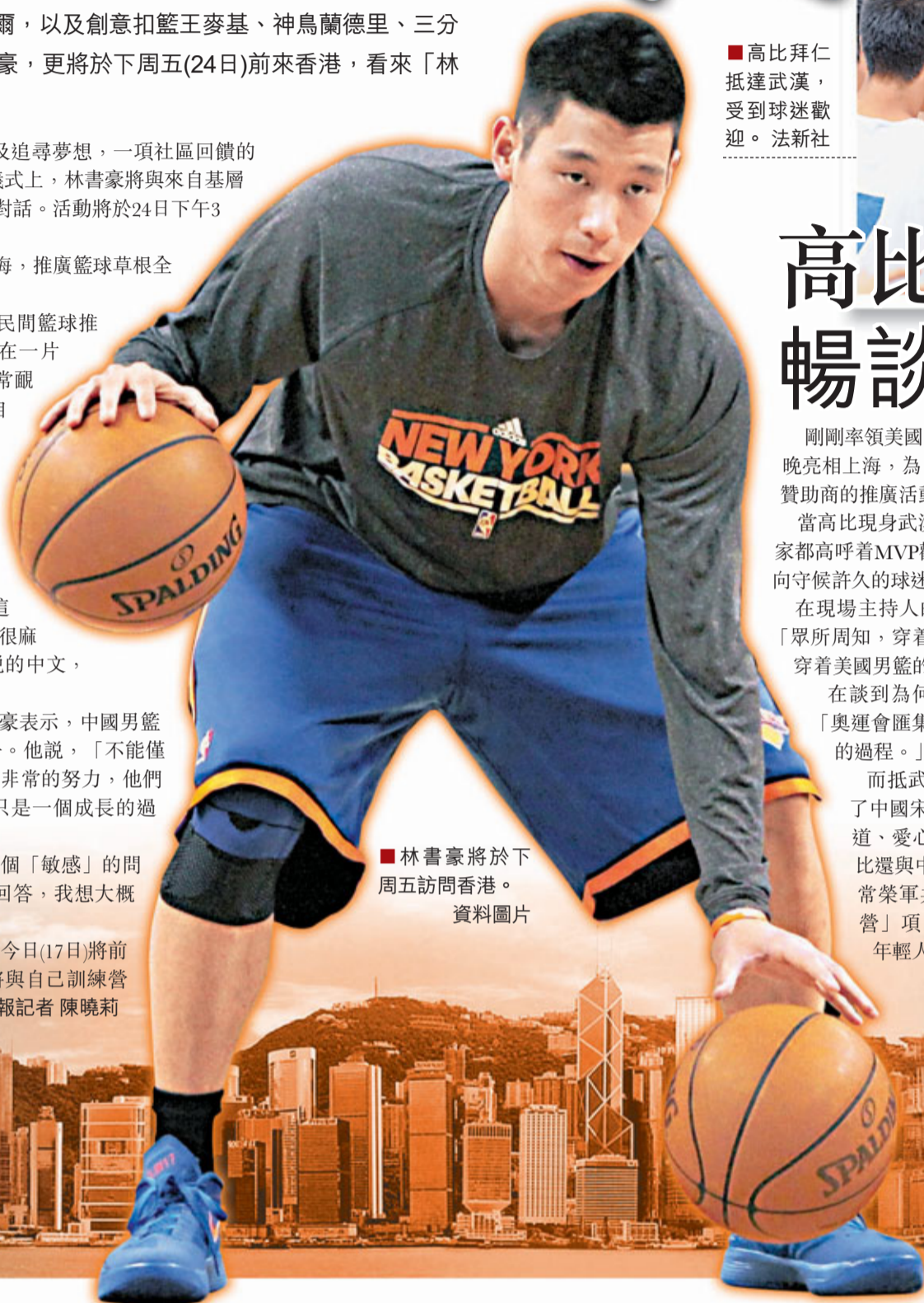
■林書豪將於下周五訪問香港。資料圖片

而抵武漢前，高比14日在上海出席了中國宋慶齡基金會主辦的「運動有道、愛心無疆」公益晚宴。當晚，高比還與中國宋慶齡基金會常務副主席常榮軍共同開啟了「高比籃球交流營」項目，希望通過體育運動鼓勵年輕人奮發上進。 ■香港文匯報記者 陳曉莉