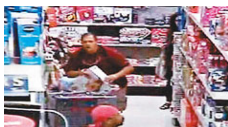
■從店內的閉路電視所見，邁克爾犯案時把玩具偷龍轉鳳。