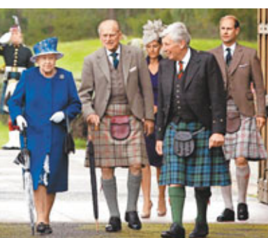
■菲臘親王(左二)上周曾與英女王及家人一同外出。

英國菲臘親王前日膀胱炎復發，被送往蘇格蘭東北部的阿伯丁皇家醫院治療，料需留院數日。年屆91的菲臘親王一向頻繁參與王室活動，但近年健康明顯轉差，今次已是8個月來第3次入院，國民深感憂慮。