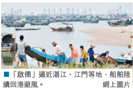
「啟德」逼近湛江、江門等地，船舶陸續回港避風。網上圖片

香港文匯報訊(記者 顧一丹 廣州報道)記者從廣東省氣象局了解到，今年第13號強熱帶風暴「啟德」已於16日05時在南海北部海面加強為颱風，16日14時，其中心位於廣東省湛江市東南方約600公里的海面上，即北緯19.4度，東經115.8度。預計「啟德」將以25公里左右的時速向偏西北方向移動，逐漸向廣東省中西部沿海地區靠近，強度仍有所加強，將於17日凌晨在中午在台山到徐聞之間沿海地區登陸。受「啟德」影響，16日夜間到18日，粵西、珠江三角洲有暴雨到大暴雨、局部特大暴雨，其餘地區有大雨到暴雨；19日，