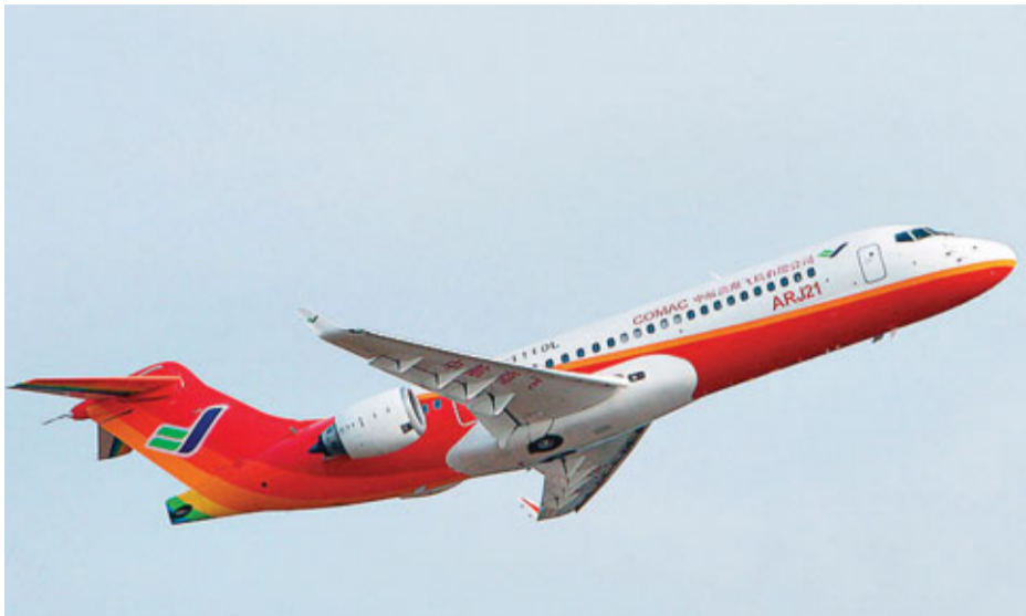
中國商用飛機有限責任公司與美國波音公司共同研究將「地溝油」轉化為航油。圖為中國商飛公司客機。

波音中國總裁馬愛倫稱，中美航空節能減排技術中心成立，表明雙方公司致力於在應對降低碳排放等行業挑戰方面取得進展。這些行業問題無法由單獨的一家公司