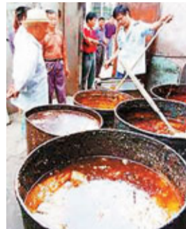
中國每年消耗約2900萬噸食用油。

中國每年消耗約2900萬噸食用油。據統計，單北京市每年消耗食用油約60萬噸，而國內食用油使用過程中的廢棄量大約佔總量的15%，照此推算，北京每年大致會產生「地溝油」9萬噸。來源：綜合內地報章及網站