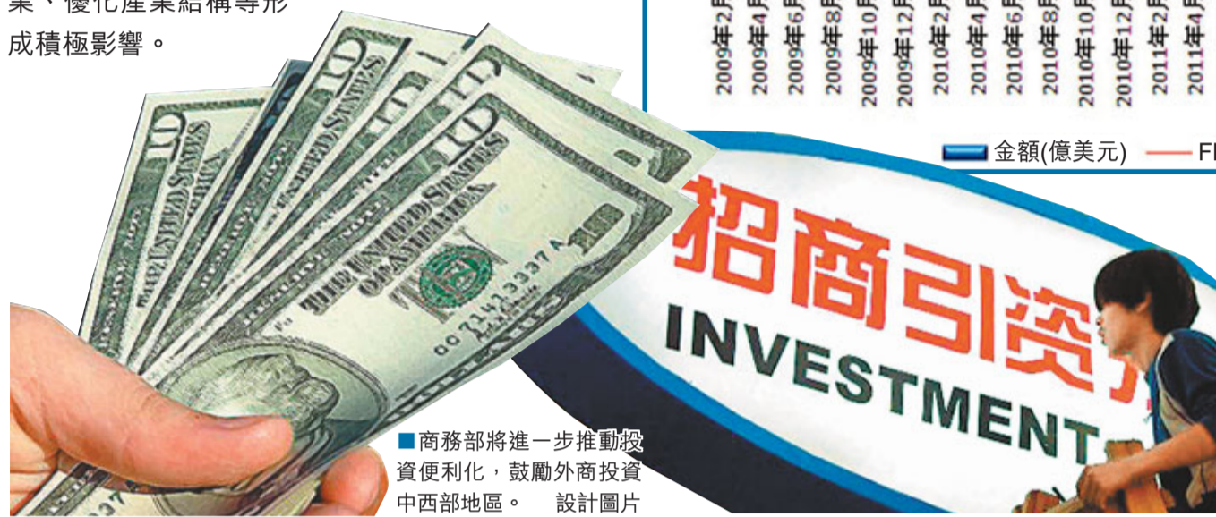
■商務部將進一步推動投資便利化，鼓勵外商投資中西部地區。 設計圖片

沈丹陽表示，今年1-7月吸收外資具有三個特點：一是農林牧漁業、製造業、服務業實際使用外資均有下降；二是美國對華投資由降轉增；三是中部地區吸收外資保持較快增長。