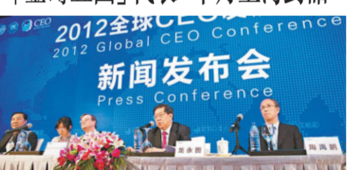
■龍永圖昨宣佈2012年全球CEO發展大會將於10月在上海舉行。 香港文匯報上海傳真

香港文匯報訊(記者 莊亞權 上海報道)聯合國工業發展組織友好大使、前外經貿部副部長龍永圖昨日在滬表示，由聯合國工業發展組織、全球南南發展中心共同舉辦的2012年全球CEO發展大會將於10月在上海舉行。屆時以「金磚五國」為代表的30多個國家的政企高層將集聚上海，就全球金融危機後，大轉型下的新興經濟體國家的深層合作以及新興經濟體結構調整等問題進行深度對話。 龍永圖表示，2011年，「金磚五國」就新興產業合作簽署了相關協議，引起國際社會的廣泛關注。今年，大會將根據「金磚五國」國家領導人3月份達成的合作框架，就技術轉移、資源合理運用以及市場分配等進行對話，並在去年「金磚五國」戰略合作框架下，推動產業合作再邁出一步，為全球經濟增長提供支持。