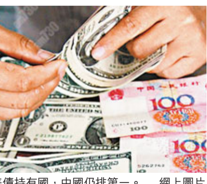
■美債持有國，中國仍排第一。

美財政部所公佈的美債數據可能存在較大誤差，若某國通過第三國市場間接購買或出售，該國持有的美債可能被大幅低估或高估，美財政部常對此前公佈的數據大幅修正。依據修正後的數據，近來，中國對美債總體呈減持趨勢：今年1月增持143億美元，2月減持110億，3月減持112億(初報為增持147億)，4月增持204億(初報為增持15億)，5月減持4億(初報增持52億美元)。去年末5個月，即2011年8-12月，中國連續減持美債，5個月總計減持1630億美元。