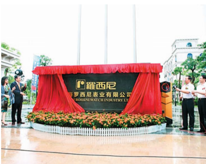
羅西尼總部新產業基地啟用,將打造為廣東省首個大型鐘錶文化產業園。

此外,羅西尼總部將是廣東省內第一個大型鐘錶文化產業園,隨後將啟動鐘錶文化博物館及工業旅遊項目。將首次全面對外展示和演繹鐘錶文化及國際水準現代製錶工藝,展現中國傳統計時文化和現代鐘錶製造工藝全景,打造成以時間為主題的工業旅遊景點,匯聚科普、觀賞、參與、娛樂休閒多種特色體驗,堪稱國內最具規模、最現代化的生產基地和鐘錶文化工業旅遊示範區。