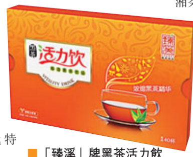
「臻溪」牌黑茶活力飲