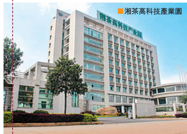
湘茶高科技產業園

湘茶高科技產業園地處國家級隆平高科技園內,佔地面積80畝,總建築面積5.4萬平方米,年加工能力2萬噸,於2008年12月5日正式開工奠基,2012年上半年正式進行試生產;正式達產後可實現年產值10億元,可從根本上幫助解決湖南省1萬噸夏秋茶的出路,直接帶動湖南省3萬戶以上農戶從根本上致富。