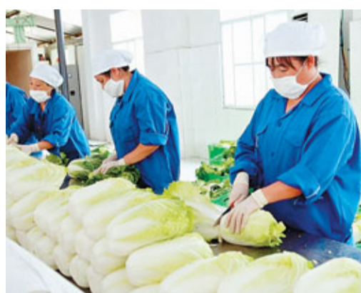
武隆港峰蔬菜冷鏈物流中心員工正在包裝將運往香港的大白菜。

香港文匯報訊(記者 袁巧 重慶報導) 重慶武隆縣是重慶第一個生鮮蔬菜直供地,從去年11月已向香港出口蔬菜500噸,目前,武隆蔬菜日出口量達20噸,並獲得香港供應商不限量供應的認可。