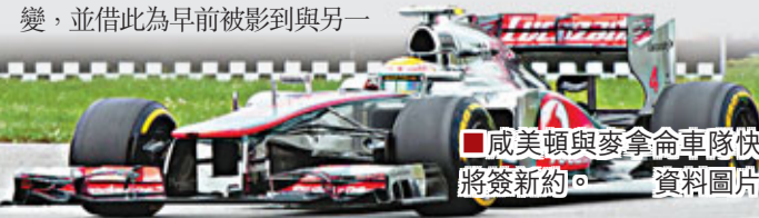
咸美頓與麥拿侖車隊快將簽約。資料圖片