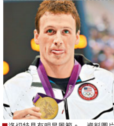
洛切特具有明星風範。資料圖片