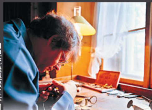
總統錶製錶工作間