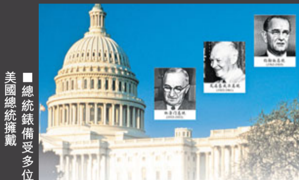
總統錶備受多位美國總統擁戴

1986年總統錶進駐香港市場，當時只有英文名稱Revue Thommen，經過一輪的提議，還未能找到合適的中文名稱，最後因為以上一段往事，落實了「總統錶」這個名稱。