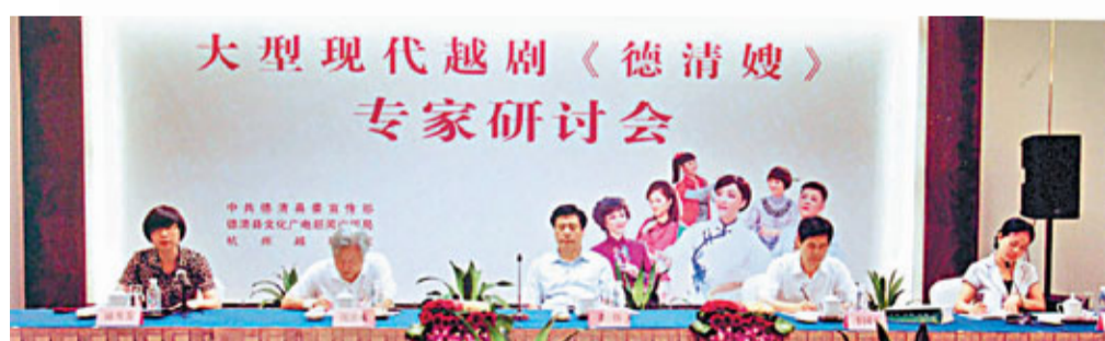
《德清嫂》專家研討會