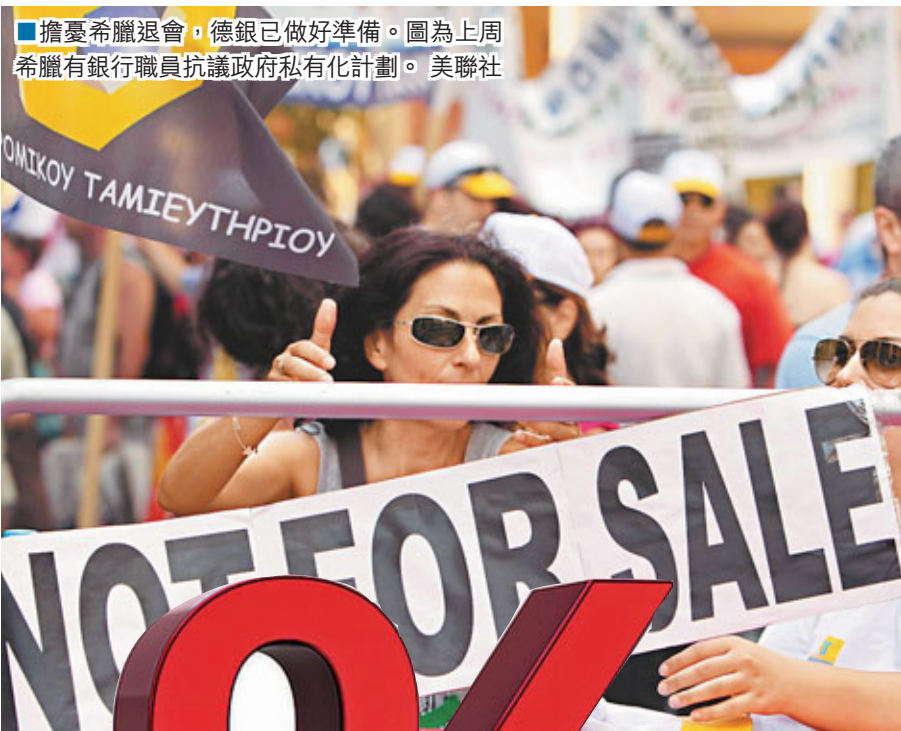
■擔憂希臘退會，德銀已做好準備。圖為上周希臘有銀行職員抗議政府私有化計劃。

歐元區多國昨日公布上季經濟數據，德國增長放緩至0.3%，較預期為佳。法國則連續3個月錄零增長，但已超出市場預期。消息刺激歐元連升兩日，昨一度升0.4%，報1.23美元。歐盟統計局昨日公布，歐元區上季經濟按年收縮0.4%，符合預期。希臘昨拍賣40.6億歐元(約389億港元)3個月期短債，債息較上月升0.15厘。 ■美聯社/彭博通訊社/《華爾街日報》