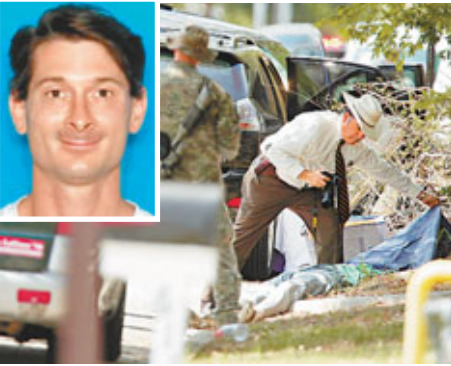
■槍手(小圖)向民居開火，警員檢視現場一具遺體。

美國一個月內發生第3宗嚴重槍擊案，一名槍手前日在得州農工大學附近民居開火，造成3人死亡，包括槍手及一名加入警隊逾19年的警員，另有4人受傷，均無生命危險。據悉，兇徒是槍械愛好者，近年有精神問題。