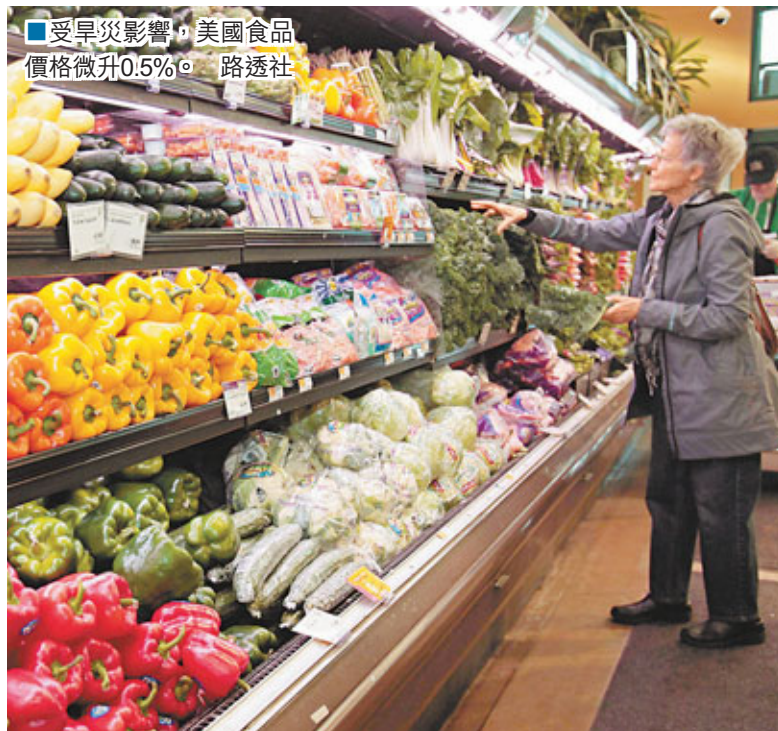
■受旱災影響，美國食品價格微升0.5%。