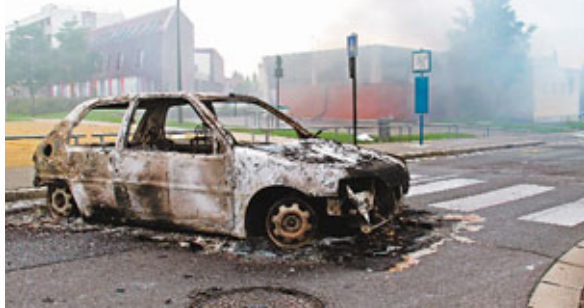
■街道有車輛遭焚毀，四周滿布濃煙。

法國北部城市亞眠前晚發生騷亂，逾百青年肆意偷車搗亂，又縱火焚毀學校及青年中心，當局出動最少150名防暴警察鎮壓，共16名警員及3名車主受傷，無人被捕。有媒體認為，騷亂前一日，民眾不滿警方拘