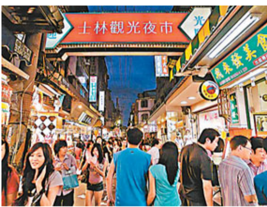
台北士林夜市是觀光客必訪美食地，生意紅火。

可以知道的是說，他們既然一次買，就是對未來會有統一性規劃，(總售價)應該有25億元以上。」商團帶動士林夜市，黃金店面以文林路最值錢，每坪就400到500萬元，這次港商買的基河路店，佔每坪350萬元，1戶約3.5億，8間全包就砸約28億，外界認為香港客出手，可能另有規劃。豪宅貸款限縮後，店面市場卻相對熱絡，除了士林、大安、信義、A咖商團今年3到6月，漲幅就有4.5%；B咖商團中山、中正，釋出多價格合宜，漲幅更有7.8%，就是觀光題材發酵，讓台灣金店面，外資也虎視眈眈。