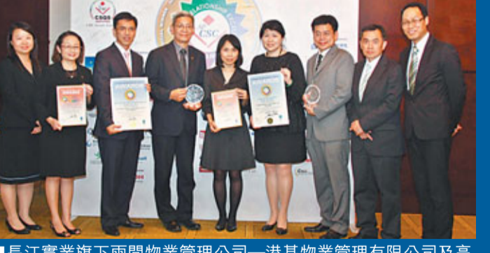
長江實業旗下兩間物業管理公司—港基物業管理有限公司及高衛物業管理有限公司，於亞太顧客服務協會舉辦之「2011亞太傑出顧客關係服務獎選舉」中，分別勇奪「最佳企業服務隊伍」及「最佳顧客體驗(物業管理)」兩項大獎。

長江實業旗下兩間物業管理公司—港基物業管理有限公司及高衛物業管理有限公司，秉承為業戶提供優質服務的宗旨，於亞太顧客服務協會舉辦之「2011亞太傑出顧客關係服務獎選舉」中，連續第五年脫穎而出，今年再次憑藉卓越管業服務，分別獲頒「最佳企業服務隊伍」及「最佳顧客體驗(物業管理)」兩大獎項。